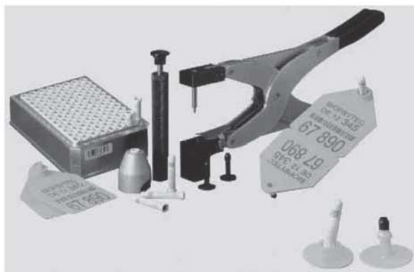
Figura 4. Sistema Biopsytec de identificación y trazabilidad animal.

Biopsytec system for animal ID and traceability.