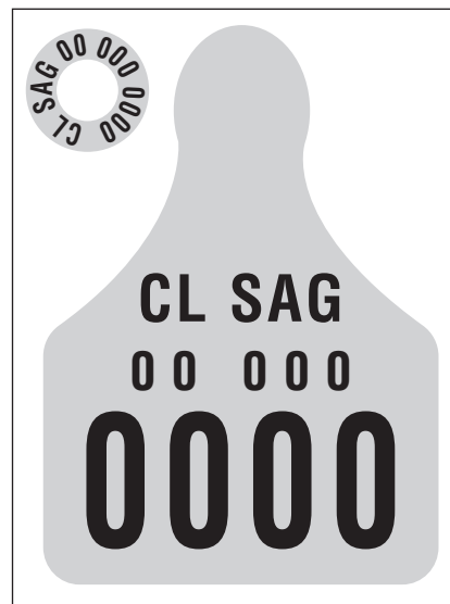
Figura 1. Modelo de dispositivo de identificación oficial (DIIO) implementado en Chile.

Métodos de identificación electrónica (IDE). La necesidad de disponer de métodos de identificación animal que faciliten la trazabilidad de sus productos y que puedan ser usados globalmente despertó el interés por la identificación electrónica (IDE) mediante dispositivos pasivos de radiofrecuencia que utilizan radiaciones electromagnéticas no ionizantes. Estos sistemas están constituidos por dispositivos electrónicos pasivos de pequeño tamaño llamados transponders (figura 2 A) que son sondea-