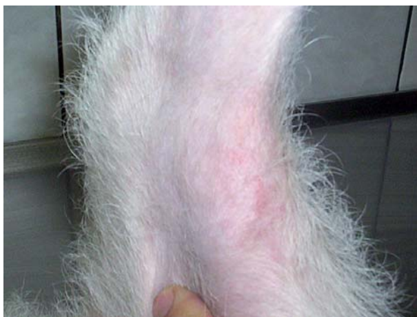
Figura 1. Cara interior del muslo que muestra lesión seborreica, pelaje opaco y áreas de alopecia hiperpigmentadas e hiperqueratinocíticas con borde eritematoso.

Al examen dermatológico, se evidencia pelaje opaco, seborreico, de fácil depilación a la tracción, con una rarefacción pilosa generalizada, áreas de alopecia hiperpigmentadas e hiperqueratinocíticas con borde eritematoso, circunscritas en la cara interior-caudal de ambos muslos (figura 1). Además, se observan ambos conductos auditivos externos eritematosos, con pápulas e hipertrichosis y furunculosis perianal. La paciente presentó prurito en más de cinco ocasiones durante la consulta, manifestando lamido abdominal, interdigital y perianal, así como rasquido de la cabeza con las garras de las extremidades posteriores.