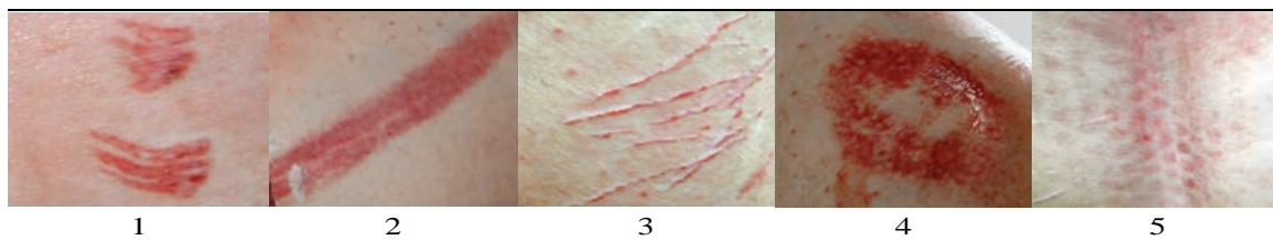
Figura 2. Clasificación según las formas de las contusiones evaluadas en la canal. 1. Coma, 2. Rectangular, 3. Lineal, 4. Difusa, 5. Romboide (cámara de CO 2 ).

Classification according to shape of bruises evaluated in the carcasses. 1. Coma, 2. Rectangular, 3. Linear, 4. Diffuse, 5. Rhomboid (CO 2 chamber).