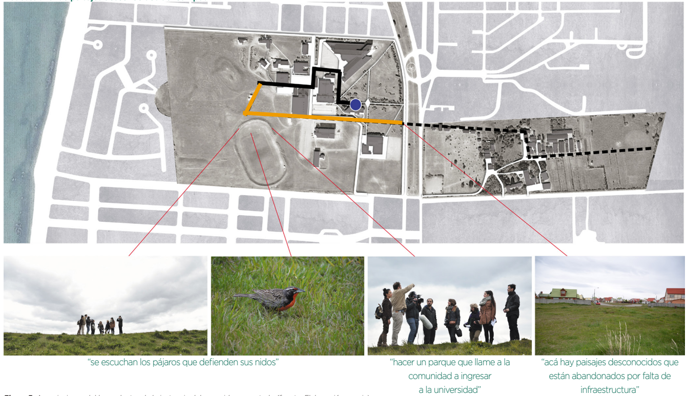
Figura 3. Apreciaciones del lugar dentro de la instancia del recorrido comentado.