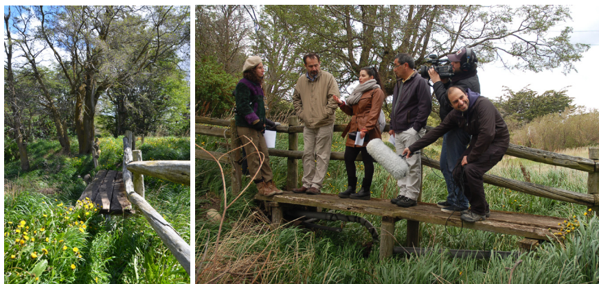
Imagen 1. Fotografía del recorrido por senderos informales.

La experiencia fue realizada con un solo grupo, conformado por una diversidad de usuarios del campus. Las investigadoras cumplían el rol de monitoras del recorrido, pero también formaban parte del equipo, interfiriendo en momentos particulares donde se detenían en el recorrido para dar la palabra, realizar preguntas y manifestar su propia experiencia como usuarios externos del campus. Incluso los camarógrafos, quienes además eran funcionarios de la universidad y exalumnos de la misma, participaron activamente del recorrido. Esta investigación muestra cómo la experiencia ayuda a generar una sensación de equipo de caminantes que experimentan el lugar en conjunto.