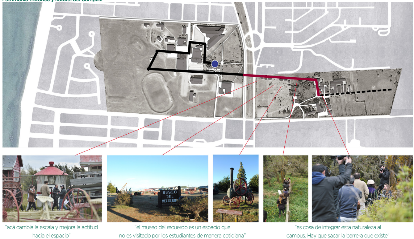
Figura 4. Apreciaciones del lugar dentro de la instancia del recorrido comentado (fuente: Elaboración propia).