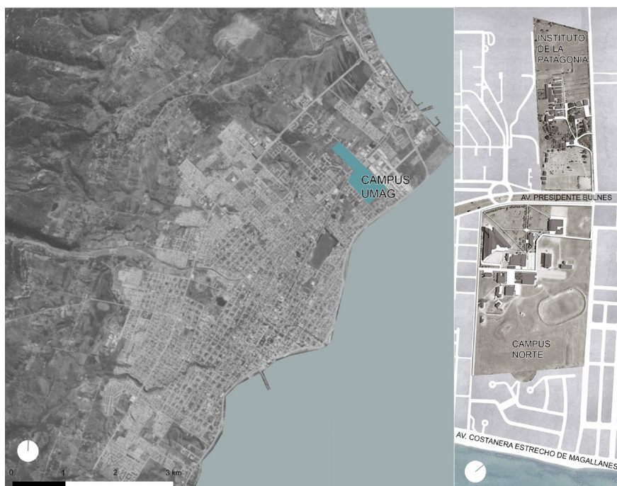
Figura 1. Plano de la ciudad de Punta Arenas. Campus Universidad de Magallanes.

El recorrido trazado incluyó una primera etapa por el corazón de la vida universitaria, lugar donde los participantes fueron convocados, y luego un itinerario en línea recta de extremo a extremo del campus, comenzando este por el fondo del predio del Campus Norte y terminando en la zona de cultivos del I.D.P. Específicamente, el recorrido cruzaba longitudinalmente el campus, atravesando espacios y situaciones diferentes. Esta decisión de recorrido fue tomada por las investigadoras a partir de la reflexión sobre los resultados que arrojó el proceso previo de participación ciudadana en relación a la escasa e ineficiente conexión entre ambos predios del campus, percibiéndose actualmente como unidades separadas. Esta experiencia fue registrada en su totalidad por la Dirección de Comunicaciones de la UMAG con cámaras de video, cámaras fotográficas y micrófonos, con el fin de tener un registro de las opiniones de cada uno de los participantes y de los lugares visitados (figura 2).