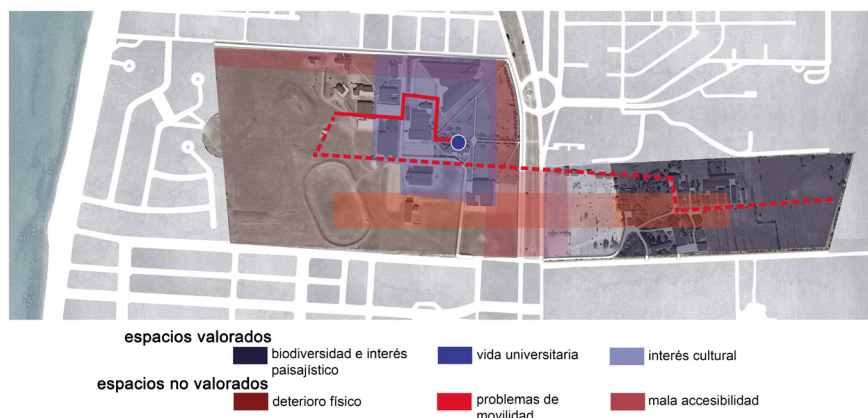
Figura 2. Plano del trazado del recorrido.