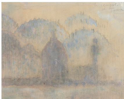
Imagen 2. Vista de la cúpula del Duomo Santa Maria del Fiore y Palazzo Vecchio, Florencia, 1907, Le Corbusier. Dibujo de viaje por la Toscana.

siglo, cuando se utiliza conscientemente el paisaje como material de proyecto. Esto sucede cuando los arquitectos Gabetti e Isola construyen el 'Residencial Oeste' en Ivrea, un edificio colocado en las ondulaciones del terreno en torno a una colina verde, cuyo aspecto y percepción cambia con las estaciones del año. Los italianos proponen en este proyecto un retorno a la naturaleza que como ellos mismos dicen "...es imposible, pero existe y todavía una vez más, lo experimentamos" (Pedio 1973: 83). La motivación principal de este proyecto es el deseo de crear un nuevo paisaje con una nueva arquitectura. La propuesta de Gabetti e Isola consiste en una arquitectura que no se impone al territorio, que no se deposita, sino que parece germinar de él. Crean un nuevo paisaje con una nueva presencia, con una arquitectura que es llevada a una fusión entre figura-fondo, diluyendo así los límites entre objeto y sujeto. Una disolución característica fundamental de la visión contemporánea. La profunda significación que toma en este proyecto el concepto de paisaje hace que en la nueva obra arquitectónica creada en el valle de Aosta se despliegue toda la comprensión y verdad de la idea contemporánea de paisaje con mayor plenitud que en la enunciación lingüística o abstracta de cualquier regla o teoría. El nuevo paisaje construido es un ejemplo, un elemento vivo en continua evolución y cambio y, por tanto, se convierte en un sujeto dinámico y moderno susceptible de proyectarse al futuro.