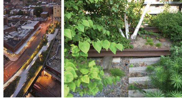
Imagen 5. High Line de Nueva York (USA), por Diller Scofidio + Renfro con James Corner Field Operations (2009) (fuentes: Izquierda: Iwan Baan; Derecha: el autor 2015).

Cada tiempo tiene su música y una dialéctica propia. Cada sociedad son palabras y notas. Las civilizaciones han construido siempre sus edificios más bellos sobre necesidades, deseos y sensaciones que acaban reflejando el momento que viven. Cada época graba sus señas de identidad en su forma de hablar, en su música, en su arquitectura. La identidad de nuestra época es su arquitectura convertida en paisaje. ▲■