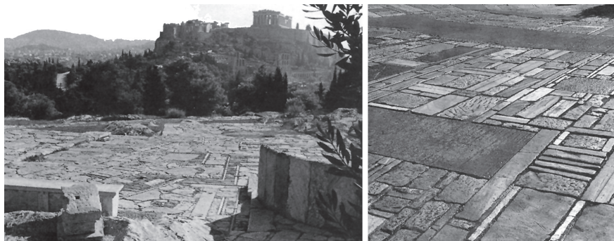
Imagen 3. Senderos de la Acrópolis, construidos en 1958 por Dimitri Pikionis, Atenas (Grecia). El arquitecto griego construye un nuevo paisaje con una arquitectura hecha de piedras.