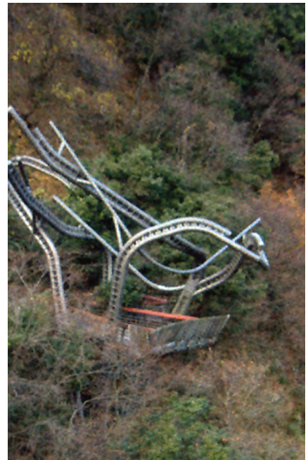
Imagen 6. Pabellón de la Meditación construido en 1993 en Unazuki (Japón) por Enric Miralles.