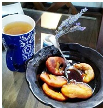
Imagen 4. Fotografía de hogar de hombre residente de la Comunidad Ecológica de Peñalolén, Santiago.

La presente revisión también muestra que la producción de conocimiento chilena, si bien ha comenzado a desarrollarse en términos que tienden a la transdisciplina, aún mantiene elementos disciplinares que organizan los modos de publicación en el campo del hogar. Si bien todas las revistas