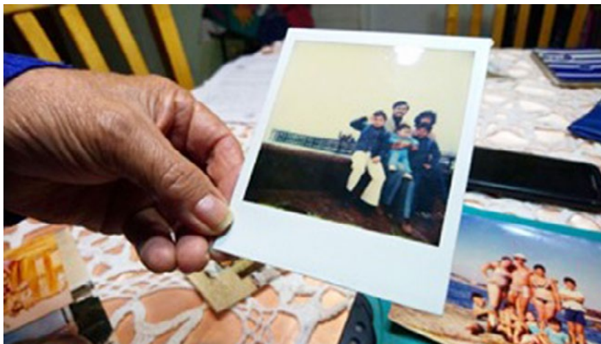
Imagen 3. Fotografías de hogar de mujer residente de Lo Hermida, Peñalolén, Santiago.

1. El hogar es complejo y multidimensional: No se agota en el nivel material ni en la cuestión del acceso a la vivienda, sino que las investigaciones chilenas lo abordan considerando también su cualidad afectiva, cultural y política.