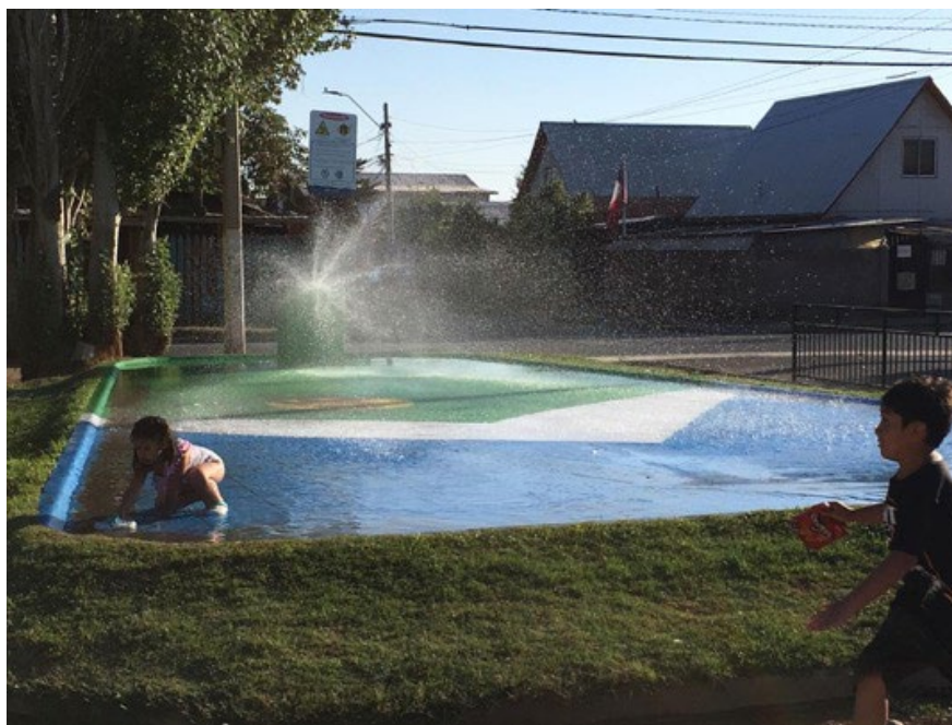
Imagen 2. Niños jugando en el exterior de Junta de Vecinos de Lo Hermida, Peñalolén, Santiago.

Esta investigación se basa en una revisión de la literatura a partir de la aplicación de criterios para vincular campos de investigación y condiciones de publicación (Torrance, 2018), desplegando una entrada al campo de estudios del hogar desde las definiciones editoriales de las plataformas