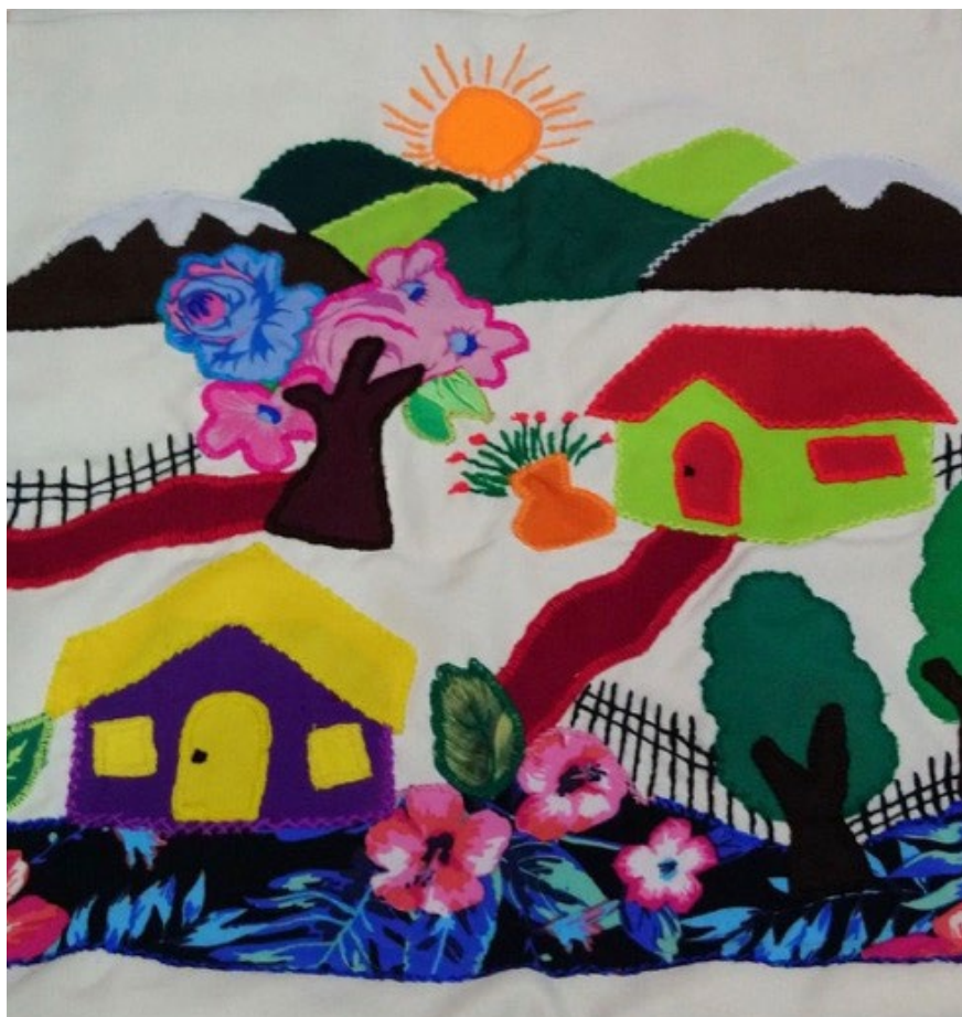
Imagen 5. Fotografía de arpillera de mujer residente de Lo Hermida, Peñalolén, Santiago (fuente: Archivo Proyecto Fondecyt N° 11160337, 2019).

de conocimiento nacionales, excluyendo la producción académica y de divulgación en otros soportes, en particular libros o revistas con otras indexaciones. La posibilidad de ampliar los criterios de elegibilidad en trabajos futuros permitiría ahondar en el análisis crítico del campo de los estudios de hogar chilenos, permitiendo analizar otras esferas no hegemónicas que también participan del campo y el trabajo que las mismas comunidades han realizado en la lucha por el hogar (imagen 5). ▲▲▲