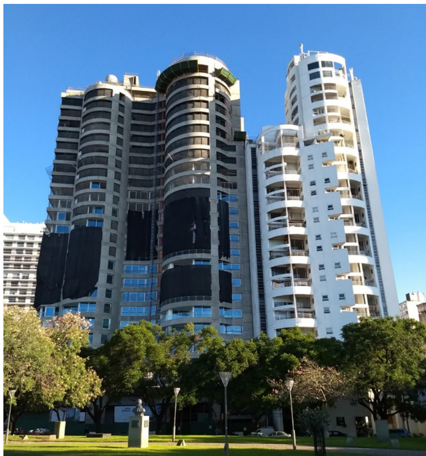
Imagen 1. Inversión inmobiliaria junto al borde costero central.

contexto se identifican proyectos de recuperación de barrios obreros antiguos cerca de la zona portuaria y también se destaca la expansión del borde costero para la zona norte de la ciudad con nuevos emprendimientos inmobiliarios que son prioritariamente residenciales (Barenboim 2011, 2014; Vera 2015). Así, las nuevas inversiones inmobiliarias incentivan no solamente la recuperación y el uso de los centros históricos, sino que también impulsan la ampliación de las zonas más cercanas al centro.