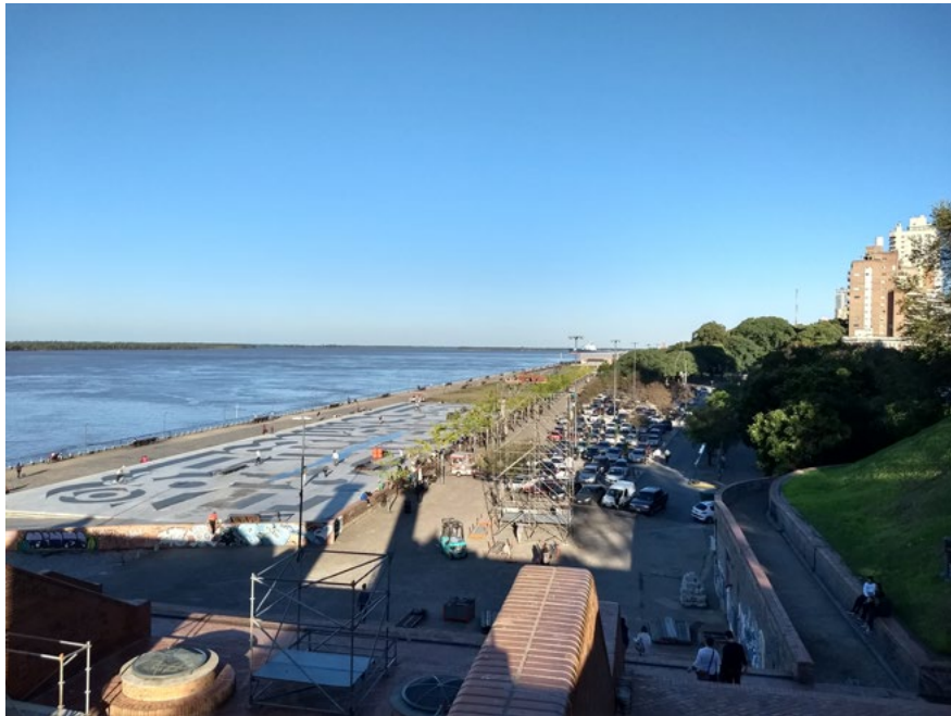
Imagen 3. Vista del borde costero desde Parque España (fuente: Archivo personal, 2019).

de edificios, plazas, parques del centro de la ciudad, aumentando los usos de los espacios centrales para actividades culturales en toda la zona central que llegaba hasta el borde costero (Barenboim 2011, 2014; Vera 2015). Junto con recuperar y ampliar parques ya existentes, también se crearon nuevos espacios públicos, generando cambios y nuevos usos de estos espacios que por un período estuvieron sin ninguna actividad.