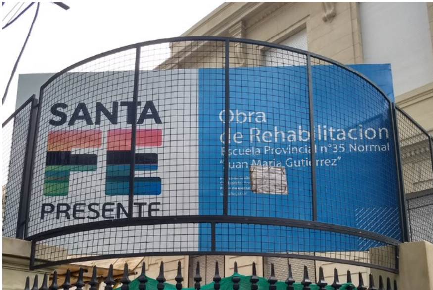
Imagen 2. Obra de rehabilitación de un edificio histórico en el área central de la ciudad.