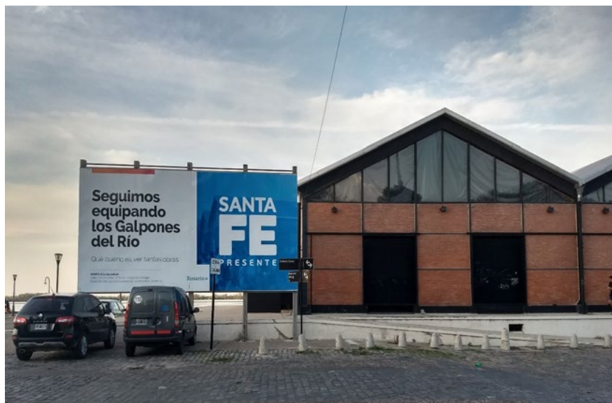
Imagen 5. Recuperación de los antiguos galpones de la zona portuaria de la ciudad.

Por lo anterior, se percibe un cambio significativo en las políticas urbanas implementadas en la ciudad, principalmente en las últimas dos décadas. Actualmente, la ciudad se proyecta de cara al río. En este sentido, la reestructuración urbana no solo transforma la materialidad de la ciudad, sino también el plano simbólico con la resignificación de la relación de Rosario con el Río Paraná. Estudios actuales analizan estos cambios y explican la interferencia de la reestructuración en la vida de la población (Roldán y Godoy 2020; Vera 2017, 2018). Las intervenciones tienen efectos contradictorios considerando que la reestructuración se vincula con la reproducción de proyectos neoliberales en la ciudad, estableciendo una reestructuración neoliberal.