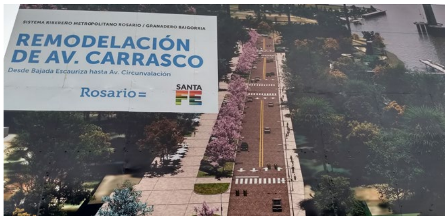
Imagen 4. Remodelación junto al borde costero norte.

un discurso ligado al mejoramiento de la calidad de vida, destacando que vivir cerca del río y del centro era la mejor opción para vivir en la ciudad. Sin embargo, el proyecto provocó una serie de cambios y conflictos que no fueron previstos. La implementación del Puerto Norte se ha transformado en uno de los principales asuntos que genera debates sobre el desarrollo urbano actual de la ciudad (imagen 4). En la zona ha impulsado una importante inserción del mercado inmobiliario promoviendo el alza del valor del suelo (Barenboim 2014). A pesar de los conflictos generados con el proyecto Puerto Norte, sigue habiendo otras iniciativas de remodelación de la zona norte del borde costero en ejecución.