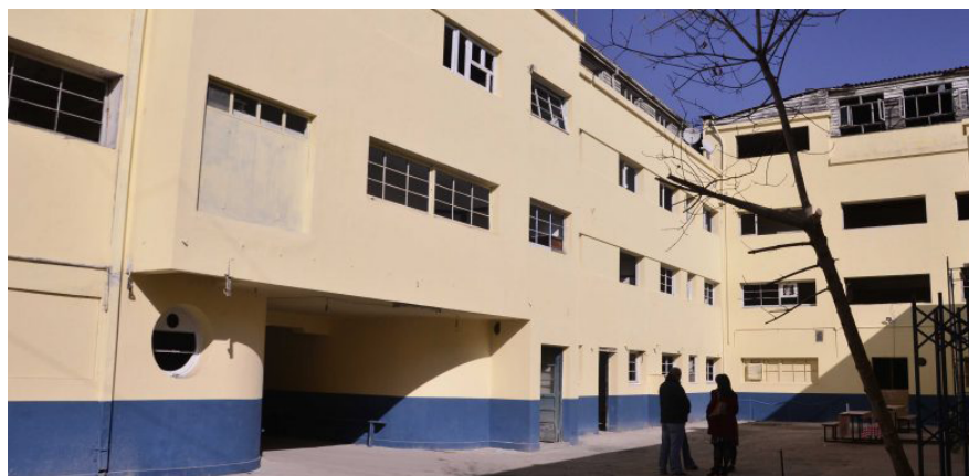
Imagen 4. Interior del edificio posterior al proceso de restauración.

CoFactoring implica la exclusión de otros usos (Figura 2). Los trabajos de refacción y acondicionamiento del inmueble proponen el asentamiento de una continuidad histórica entre lo fabril y el Nuevo lugar separados por 20 años de inactividad. El nuevo proyecto de renovación barrial viene de la mano de una nostalgia sobre la producción fabril, que opera un criterio de distinción: productos manufacturados mediante procesos artesanales y al detalle, que recuperarán el barrio y su identidad. Además, utiliza un recurso de unidad ideal con la identidad barrial folclorizada de la industria, para señalar que, como está orientado a consumidores con gusto mediante la oferta de productos de elite , es afín a las necesidades de renovación del barrio. Zukin et al. (2004), analizan cómo la idea de un comercio al detalle, vendido por los propios creadores, establece criterios de distinción (Bourdieu 2002) en relación con el gusto y la capacidad de consumo. La boutique, esa forma económica urbana previa a los procesos de industrialización y masificación de bienes, se distingue de la economía de masas dominante en las formas de consumo de la clase trabajadora. Al mismo tiempo, estos productos y actividades desplegadas por miembros de la clase media-alta o de profesionales, asumen