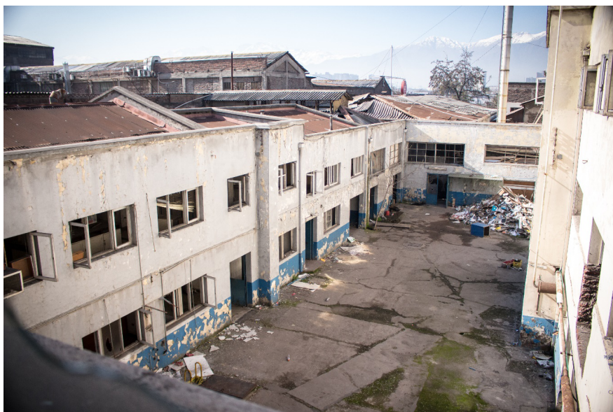
Imagen 2. Interior edificio.

los actores y las acciones que lo producen y que le dan vida y significación.