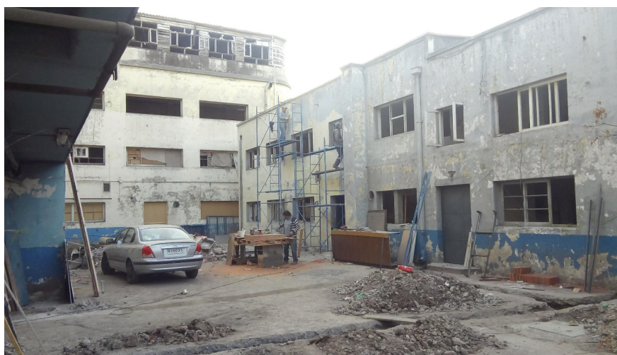
Imagen 3. Interior del edificio en proceso de restauración.

La Franklin CoFactoring Artes y Oficios es un proyecto empresarial que se reviste de individualidad mediante una serie de publicaciones en medios nacionales que definen esta inversión y renovación urbana como un proyecto impulsado por una destacada empresaria nacional, que aportará valor y productos de primera clase al barrio (Capital 2019; La Segunda 2020). La inversión viene a poner fin a las ocupaciones en el interior del inmueble durante 2015-2019 y, con ello, casi como oxímoron, a la idea de vacío y desocupación. En marzo de 2019, comienza un proceso en el cual ya no se permiten los tour fantasmas ni las partidas de airsoft ; la lucha libre ya había abandonado el edificio durante 2018. El proceso de refaccionar el inmueble para el proyecto de la Franklin