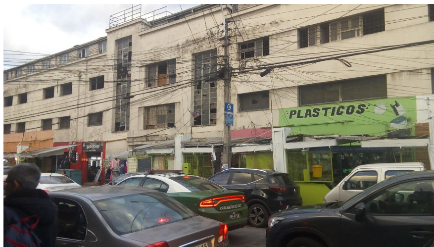
Imagen 1. Fachada del edificio Sanitas por calle Franklin.

se insertan en la idea de modernización de los procesos e instalaciones industriales “acorde a los tiempos” (Espinoza 2019). Luego de su abandono, el inmueble es adquirido por la Inmobiliaria Santa Ana, el brazo inmobiliario del Holding MonPla. A partir de este punto, se genera la controversia de su situación actual. Diferentes proyectos pensados o planificados para ocupar el edificio, como un shopping mall , una playa de estacionamiento u oficinas, nunca tuvieron lugar. Desde 2015 hasta 2019 (período estudiado), el edificio junto a la ocupación de la fachada (imagen 1), hospeda actividades diferentes a los usos comerciales: un tour fantasma, entrenamientos de lucha libre y sesiones de airsoft 5 . Todas estas actividades fueron removidas del inmueble a comienzos de 2019, cuando el edificio comienza un proceso de recuperación/remozado material como práctica de renovación para dar paso a una actividad que lo unifique.