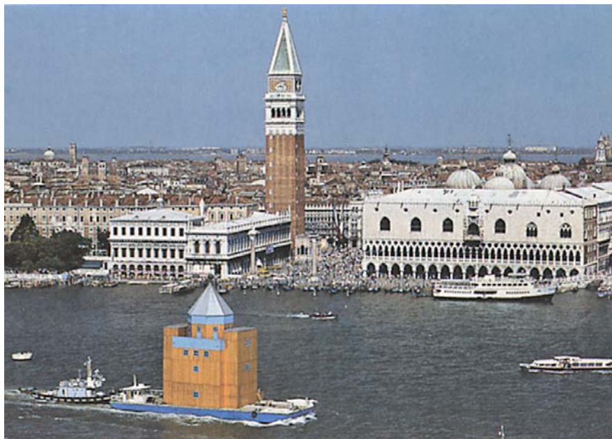
Imagen 7. "Teatro del mundo" de Aldo Rossi (Arnell, 1986).

Movilidad, transformación y tiempo son conceptos ligados a la arquitectura actual. En nuestra cultura contemporánea se atiende prioritariamente al cambio y a la transformación. Ya no se piensa en espacios fijos, establecidos por materiales duraderos, sino en formas cambiantes capaces de adaptarse a las necesidades de los usuarios en cada momento. En esta idea sobre lo efímero y la ensoñación se presenta al edificio como un sistema capaz de responder más eficientemente a las necesidades cambiantes de nuestra sociedad y a la utilización más racional del espacio y de los recursos materiales. En los últimos tiempos se trabaja cada vez más desde una desaparición del valor