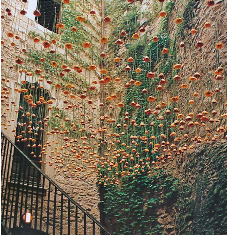
Imagen 3. Instalación de techo de flores.

y será capaz de transformar los espacios arquitectónicos. En la "Instalación del techo de flores", en la "Casa Girbal" en Girona (imagen 3), sus autores, "10x15 col.lectiu", realizaron un techo de flores en el que durante diez días, mil gerberas cortadas se secaron colgadas cabeza abajo. La intención fue modificar radicalmente la percepción habitual del espacio y aprovechar el gesto instintivo de alzar los ojos al cielo, que acostumbramos a hacer cuando se entra en un lugar de estas características. Así, se construyó un techo de flores que colgaba cabeza abajo en una red de tela metálica