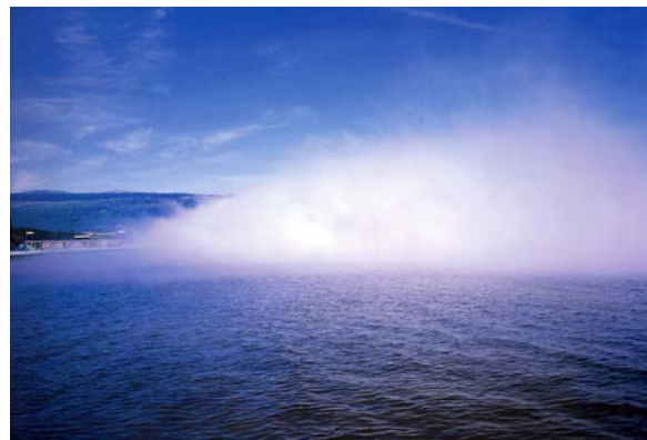
Imagen 5. "Blur Building", nube suspendida sobre el lago.