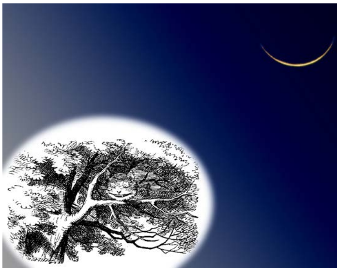
Imagen 1. Fotomontaje en el que aparece el Gato de Cheshire desvaneciéndose para sonreír.