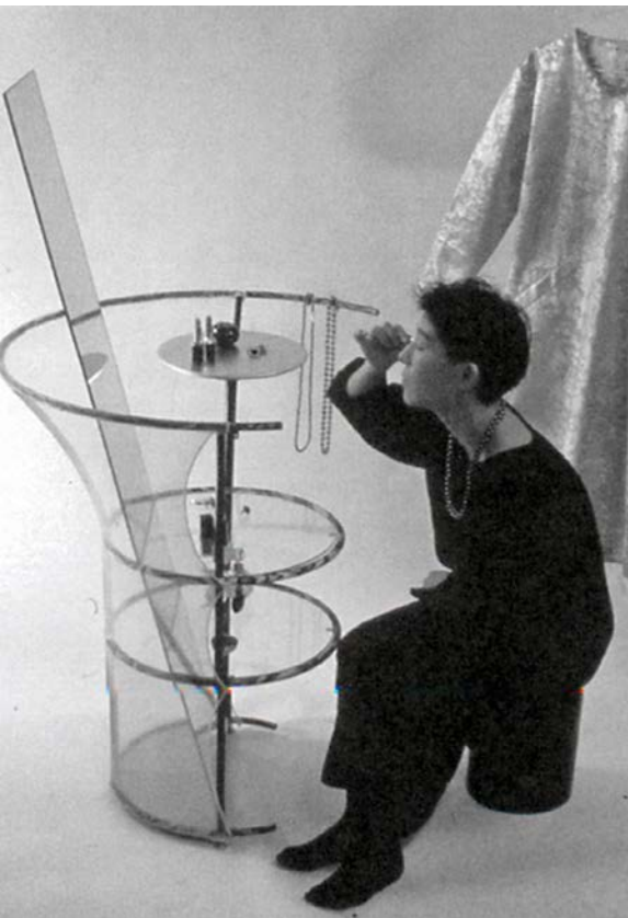
Imagen 6. "Chica nómada de Tokio" (fuente: Ito, 2004).

nómada de Tokio" (imagen 6), en que los espacios se diseñaron para ser habitados por una mujer joven, independiente y consumista, que vive sola y que deambula por la ciudad de Tokio.