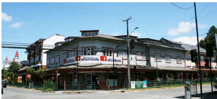
Imagen 4. Casa de altos en Del Salvador esquina San Francisco, Puerto Varas (fuente: Leonel Riquelme y Alejandra Silva, 2013).