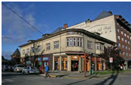
Imagen 10. Casa de altos en San Juan esquina Del Salvador, Puerto Varas. Fecha de construcción: ca. 1950. Destino: 1er nivel, locales comerciales; 2do nivel, 2 viviendas; 3er nivel, soberado.