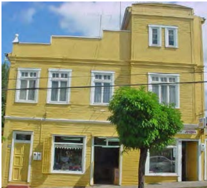
Imagen 7. Casa Galilea-Fernández, casa de altos en La Unión. Fecha de construcción: ca. 1940.

Uno de los procesos arquitectónicos quizá más desconocidos y poco reconocidos,