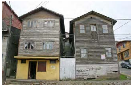
Imagen 11. Casa de altos en calle Juan José Mira esquina Ancud, Puerto Montt.