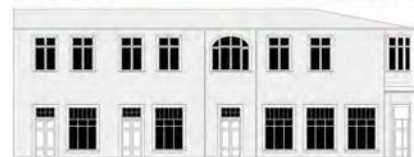
Imagen 5. Casa Rensinghoff, casa de altos en Antonio Varas esquina O'Higgins, Puerto Montt. Fecha de construcción: 1933. Destino original 1er nivel: ferretería; 2do nivel: 2 viviendas con accesos independientes.