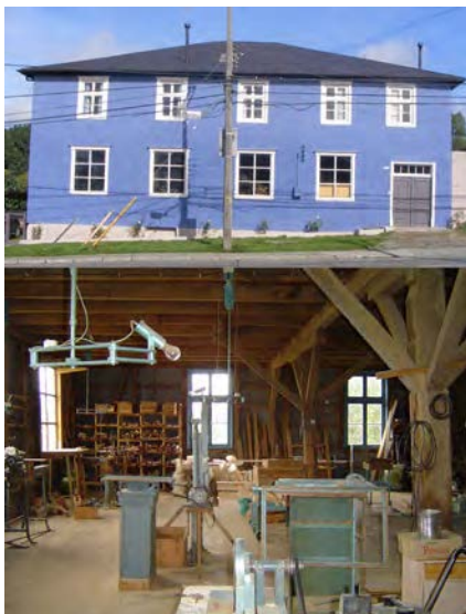
Imagen 8. Juguetería Brintrup, casa-taller de altos, Prat 350, Puerto Varas.