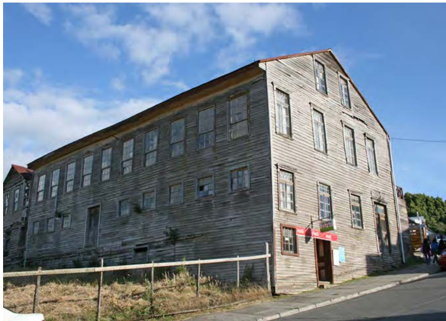
Imagen 12. Casa de altos en avda. Centenario, Chonchi, Chiloé.

corresponde al de la arquitectura moderna en madera en el sur del país, desarrollado entre las décadas de 1930 a 1960 (Cerde et al., 2005) 6 . Ello corresponde a una particular interpretación que se hace de la arquitectura moderna a través de los materiales locales como la madera y el latón galvanizado. La casa de altos adopta esta expresión arquitectónica (estructural, espacial y expresivamente) de modo que hoy es posible hablar de una arquitectura moderna de casas de altos en madera muy característica del sur de Chile (imagen 10).