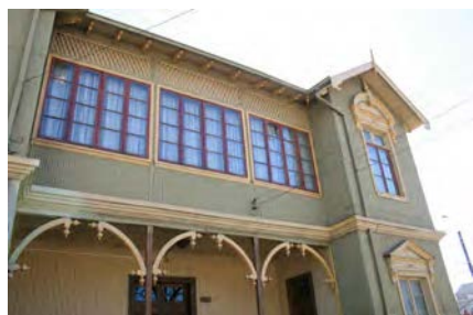
Imagen 3. Casa Rocha, Lebu.