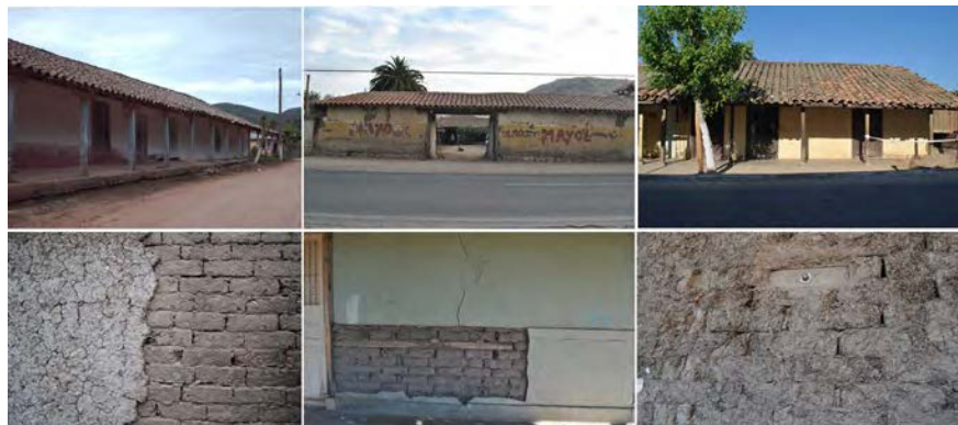
Imagen 7. Viviendas (de izquierda a derecha: Nirivilo, Pichidegüa y Paredones) y tecnologías presentes en la cultura constructiva del Valle Central.

6”, rellenos con “adobillos” de tierra de 60x15x10cm., ensamblados a la madera, que permitieron “mayor liviandad de las fábricas, rapidez en la ejecución, menores costos...” (Duarte y Zuñiga, 2007) y la posibilidad de adaptarse de mejor manera a la topografía de Valparaíso, además de lograr un buen comportamiento sismorresistente. Lamentablemente, el proceso de decadencia económica de Valparaíso gatillado por la apertura del Canal de Panamá en 1914 y presente hasta el día de hoy, no obstante la nominación como “Patrimonio de la Humanidad” por la UNESCO (2003), ha llevado a un profundo deterioro arquitectónico-urbano y a la poca valoración de la cultura constructiva. Así, las estructuras de madera son recurrentemente vaciadas de sus adobillos, restándose habitabilidad y quedando vulnerables a la deformación lateral en caso de sismo.