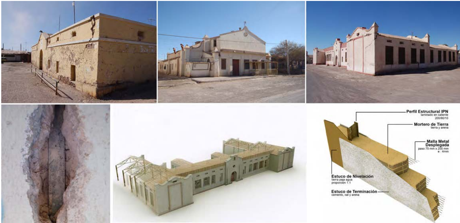
Imagen 5. Tipologías arquitectónicas (de izquierda a derecha: mercado, sindicato y ex- escuela consolidada de María Elena) y tecnologías presentes en la cultura constructiva de las Salitreras.