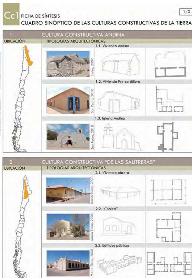
Imagen 2. Ejemplo de análisis tipológico de dos culturas constructivas.