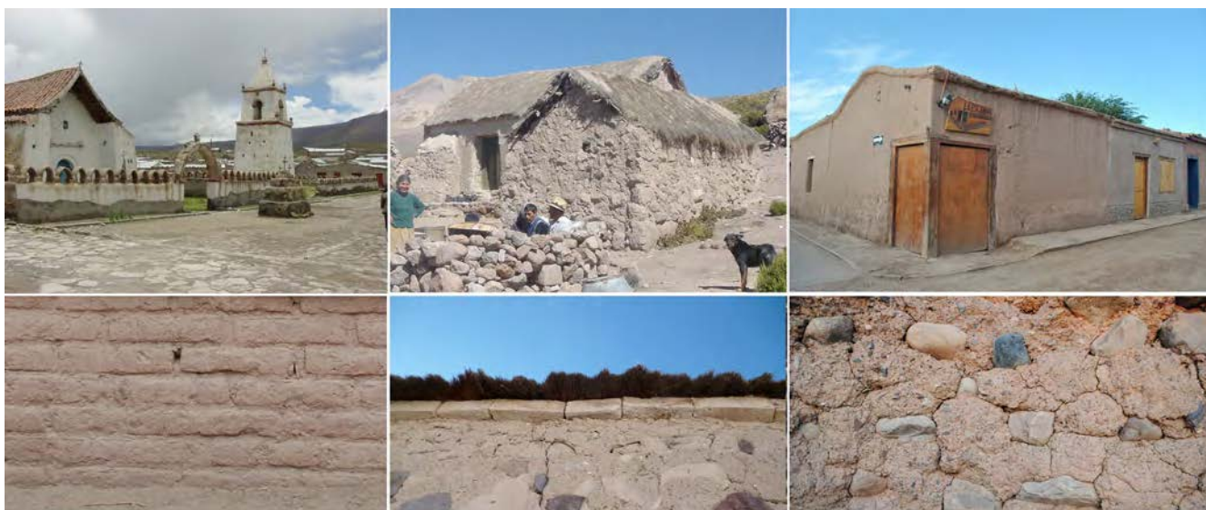
Imagen 4. Tipologías arquitectónicas (de izquierda a derecha: Iglesia de Isluga, vivienda andina de Surire y vivienda de San Pedro de Atacama) y tecnologías presentes en la cultura constructiva Andina.

La vulnerabilidad sísmica de esta cultura constructiva radica en: débiles conexiones entre los distintos componentes constructivos, estructuras de techumbre de “par y nudillo” 3 que generan empujes sobre los muros y, en general, mala calidad de los morteros de tierra empleados.