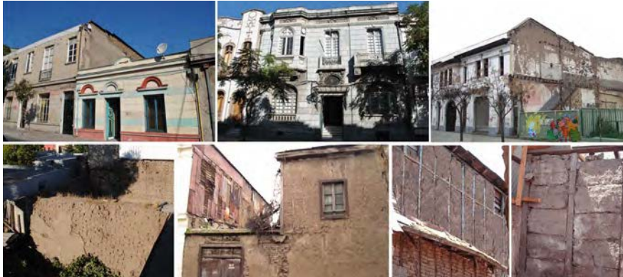
Imagen 8. Tipologías arquitectónicas y tecnologías presentes en la cultura constructiva de Santiago Poniente (fuente: el autor).