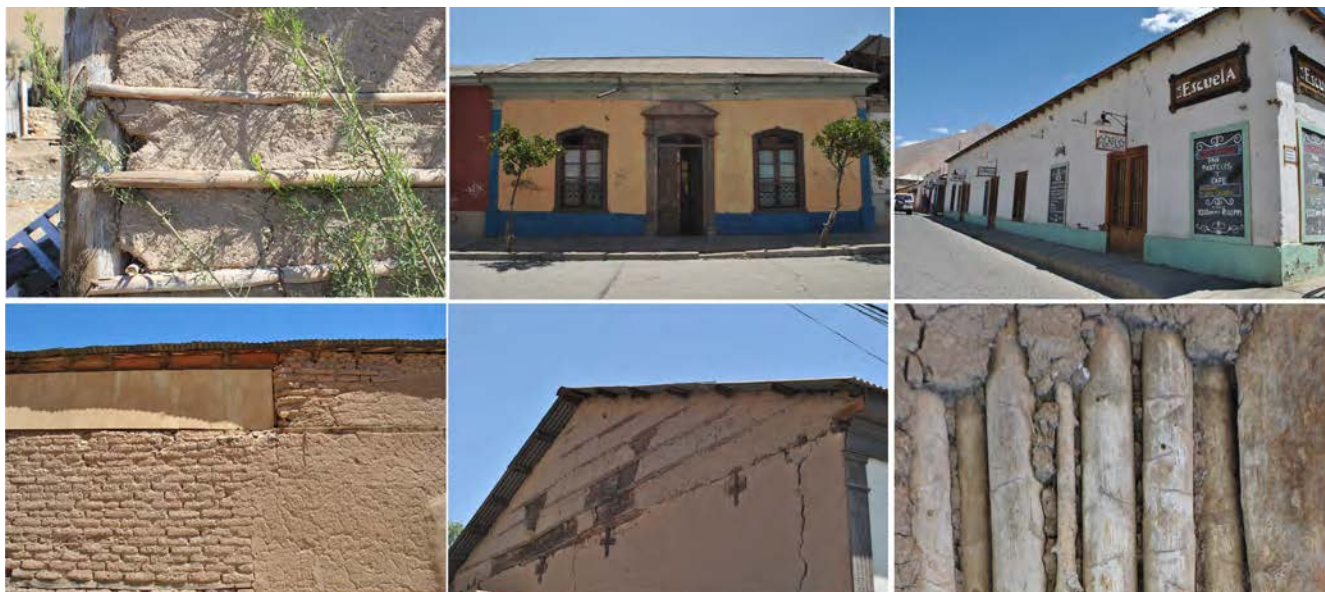
Imagen 6. Tipologías arquitectónicas (de izquierda a derecha: viviendas en el valle del Choapa, en Vicuña y en Pisco Elqui) y tecnologías presentes en la cultura constructiva del Norte Chico (fuente: el autor y María Lobos).