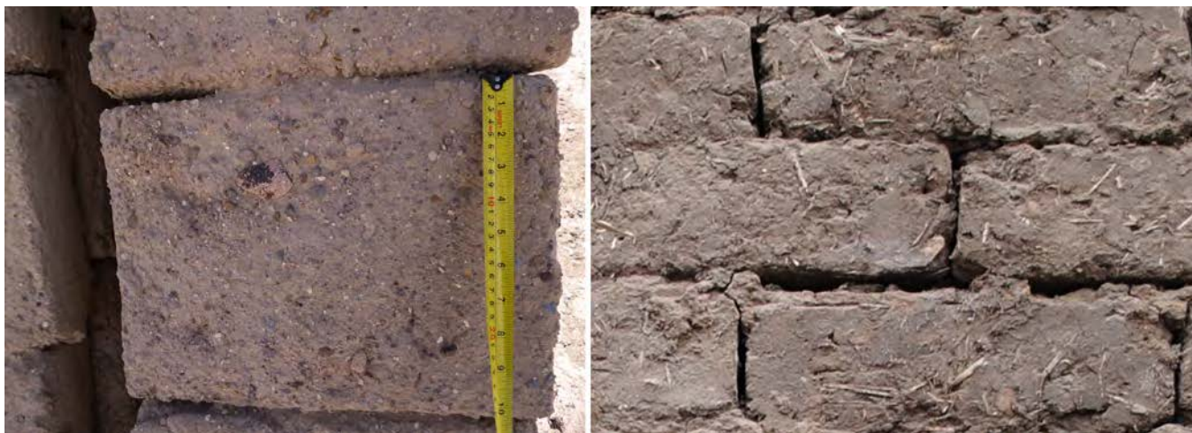
Imagen 3. Comparación entre un adobe andino de 40x30x10cm. con piedrecillas y uno del valle central de 60x30x10cm. con paja.

A través de un análisis sistémico cualitativo que comprende el ambiente, la cultura, las tipologías arquitectónicas (imagen 2) y los particulares constructivos, se logró caracterizar las diversas culturas constructivas. Así, al comparar un adobe “andino” con uno del “valle central” (imagen 3), se evidenció cómo las diferencias de dimensiones y constitución dan cuenta de dos culturas desarrolladas en distintos ambientes: una misma técnica, dos culturas constructivas. Por último, dado que la sismicidad es también una característica ambiental, se identificaron tanto las estrategias de respuesta sísmica materializadas en elementos constructivos tales como contrafuertes, cadenas de madera, etc., como los aspectos críticos del diseño constructivo y estructural que predisponen a sufrir daño, lo cual se conoce como “vulnerabilidad sísmica” (Doglioni, 2000).