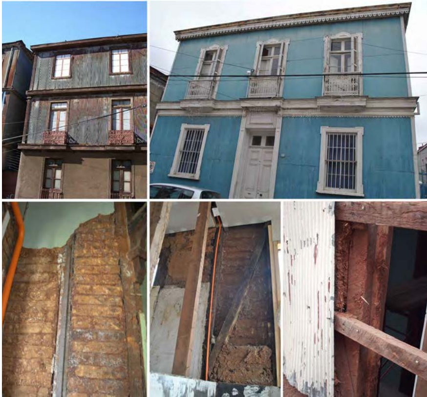
Imagen 9. Tipologías residenciales y tecnología del tabique de madera con adobillo en la cultura constructiva de Valparaíso.