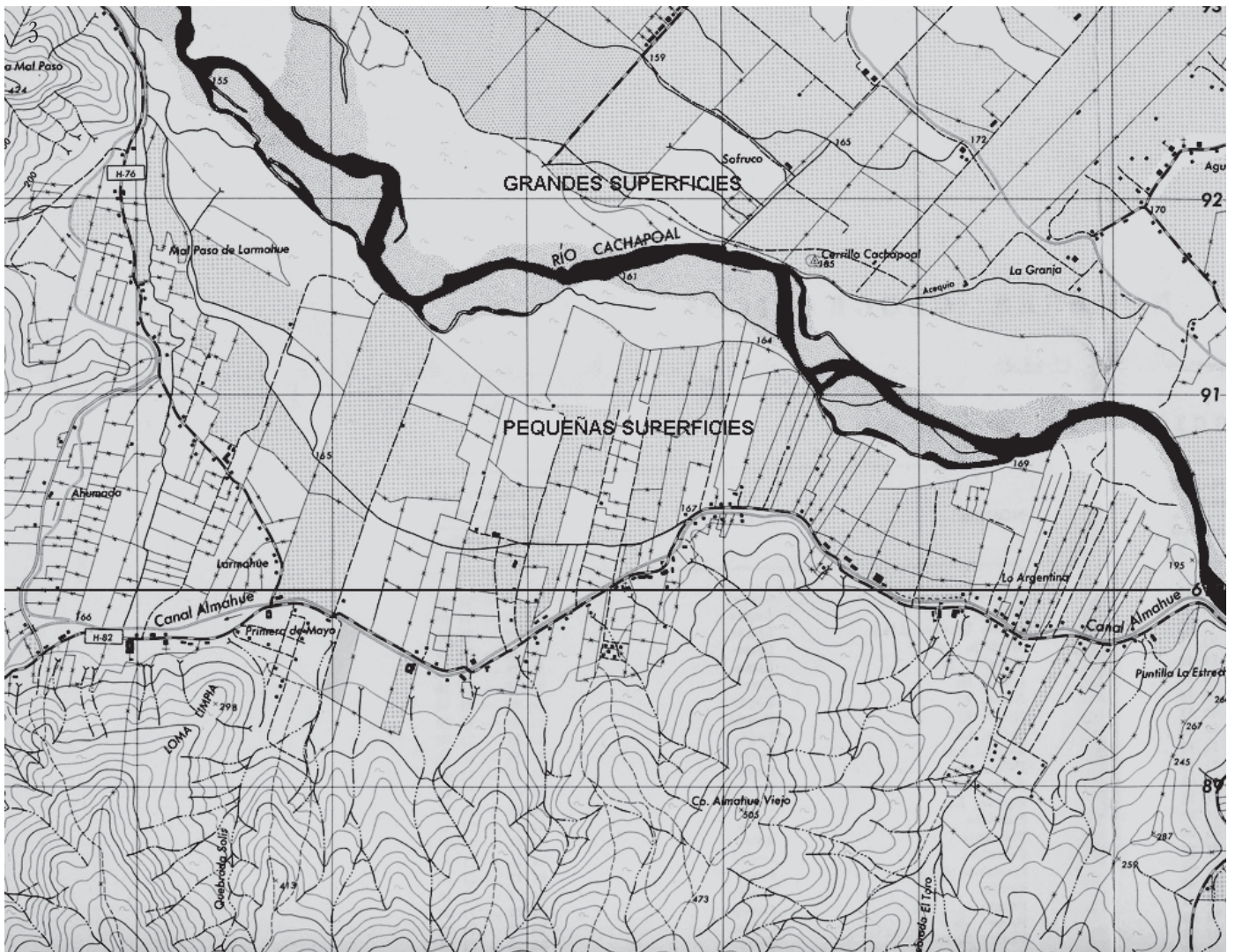
Imagen 3_ En el mapa se observan grandes superficies de suelos agrícolas en la zona norte cruzando el río Cachaipoal, exentas de viviendas y facilidades viales; mientras tanto, la zona sur registra pequeñas extensiones con profusión de viviendas rurales a orillas del canal Larmahue y la ruta H-76.