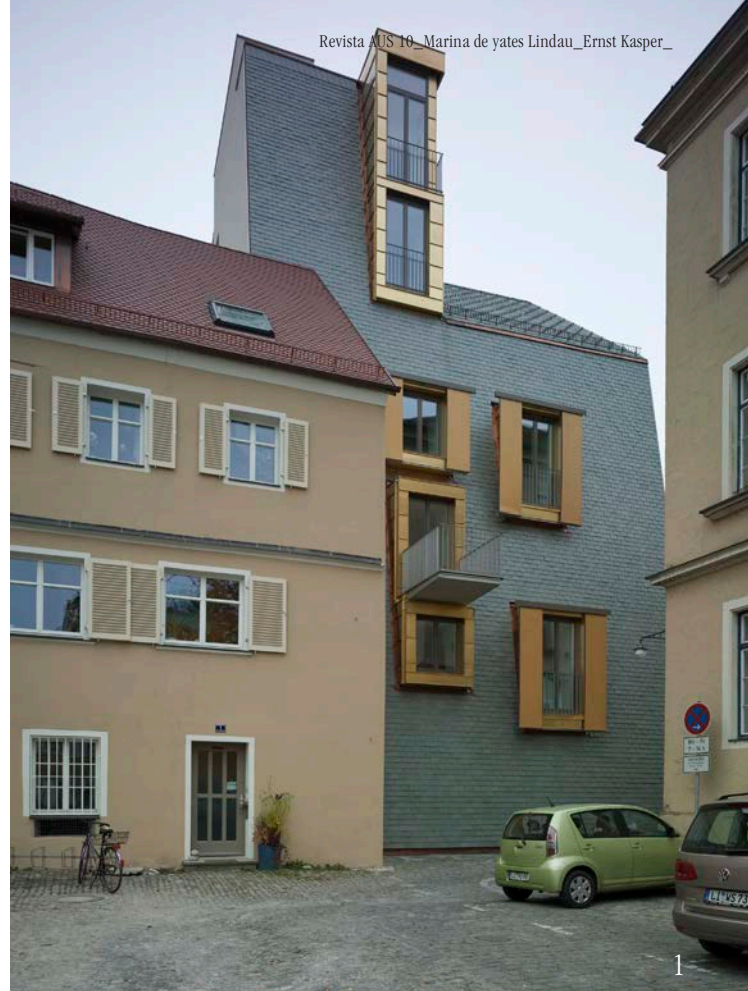
Imagen 1_Fachada de piedra pizarra.