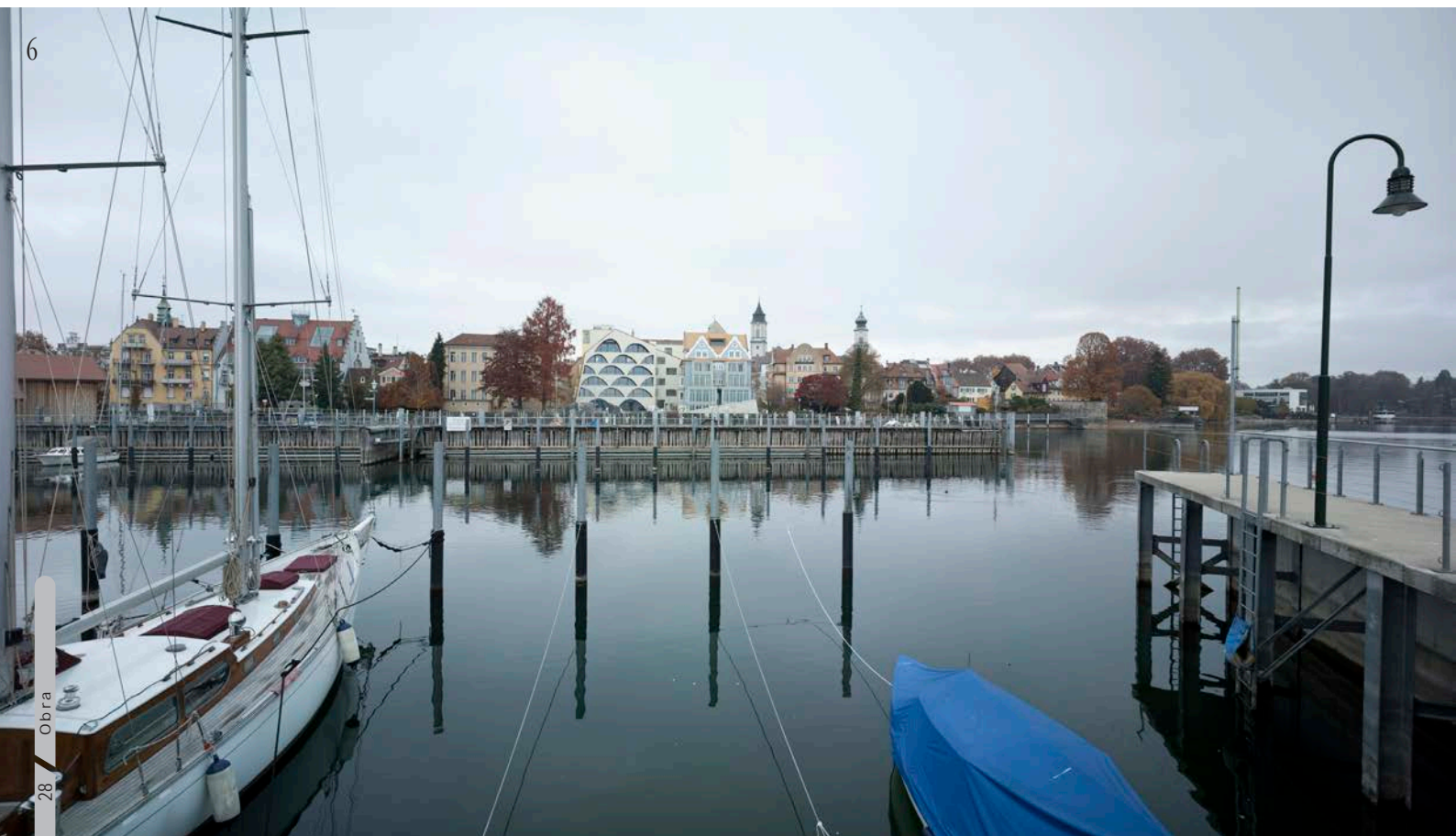
Imagen 6_Vista del proyecto desde el lago.