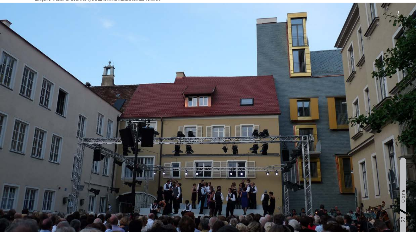
Imagen 2_Puesta en escena de ópera La Traviata.