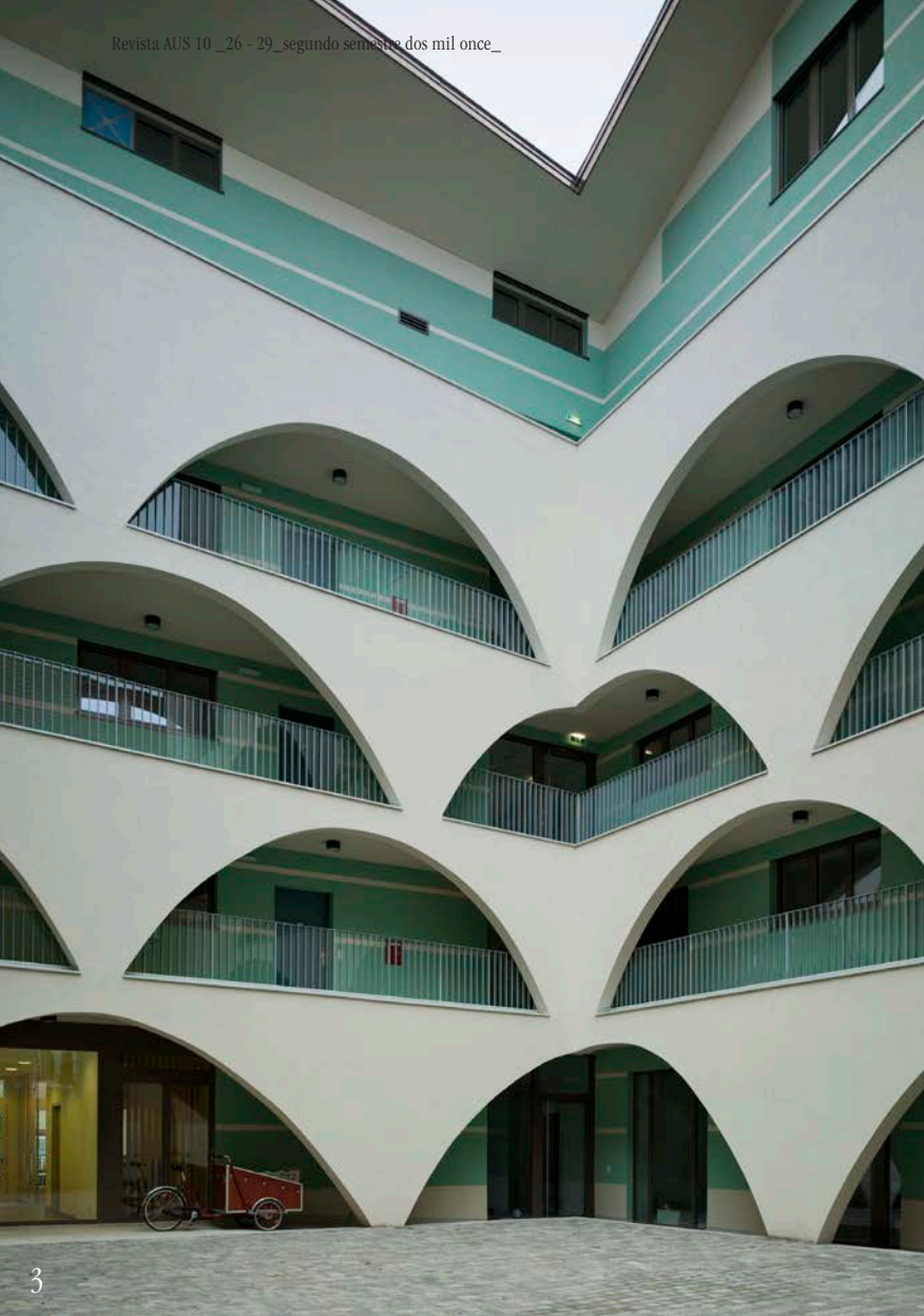
Imagen 3_Los arcos de la fachada son todos diferentes.