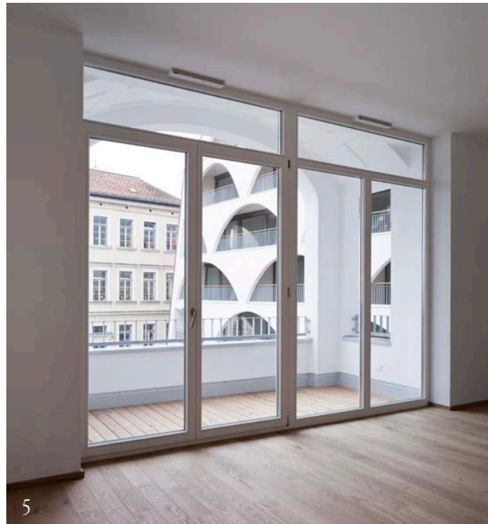
Imagen 4_Vista desde el interior hacia el lago.