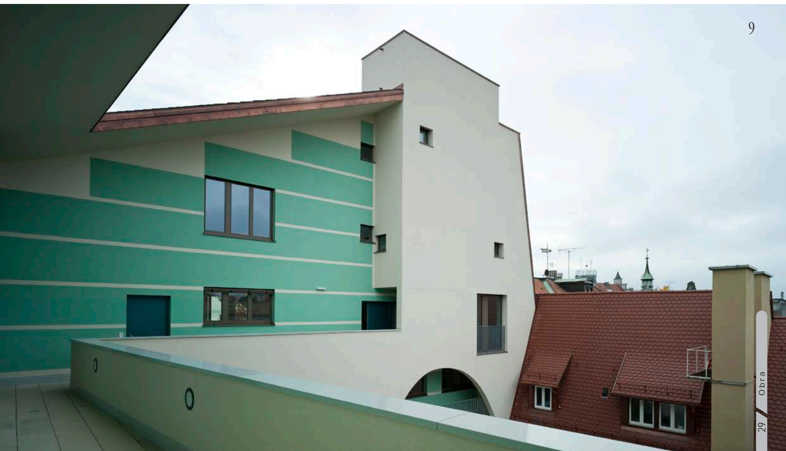
Imagen 9_Vista de corredor interior del proyecto.