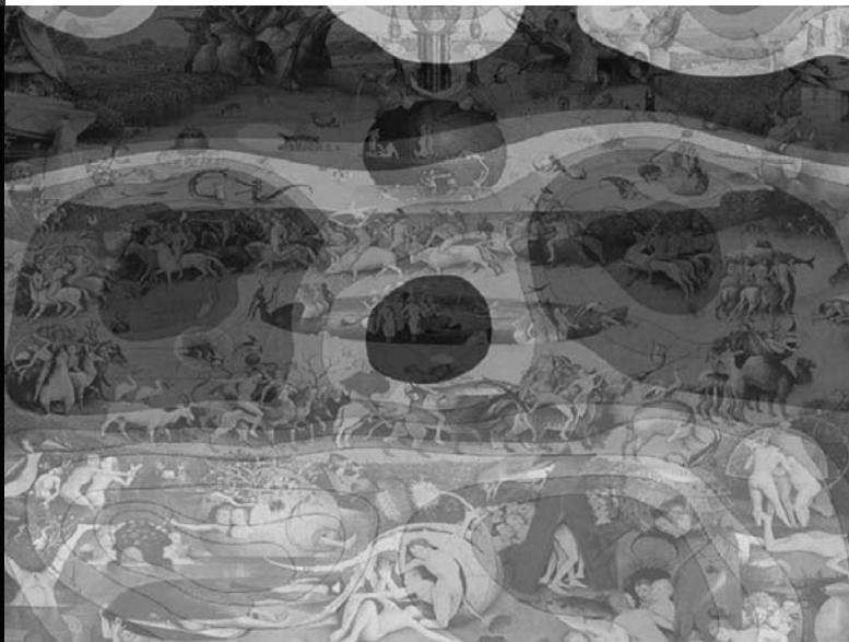
Acción comparada: Aguiña “Entre la ecuación del Ser Estético: Jorge Oteiza en el Cromlech de Aguiña”

Resulta una evidencia que las producciones derivadas serían tantas como puntos de partida, pero ahora nos interesa solamente, fijarnos en los posibles lugares de coincidencia, en los enlaces capaces de establecer redes de conversión y transformación. Veamos desde dónde se construirían algunos paisajes. . .