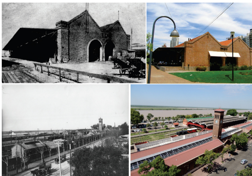
Imagen 3. Antes y después del Galpón N° 10 y de la Estación Rosario Central.

A mediados de 1980, en el marco de dicha reconversión costera, desde distintas entidades se reclama la importancia de la preservación de estos componentes de relevancia histórica e identitaria para Rosario y su región 2 . La Municipalidad de Rosario, en el marco del Plan Maestro de la Costa, inicia las tareas de rehabilitación de este predio, junto a otras acciones de transformación urbana como la duplicación de la traza de la avenida ribereña, que conduce a la demolición de diversas instalaciones ferro-portuarias. En este sentido, si bien se rehabilitan construcciones ferroviarias, como el Galpón N° 10, la Estación Rosario Central y las edificaciones correspondientes a los tanques de agua de ferrocarriles, también se producen numerosas demoliciones y levantamientos de vías férreas. Asimismo, estas construcciones son modificadas parcialmente, en especial en su interior,