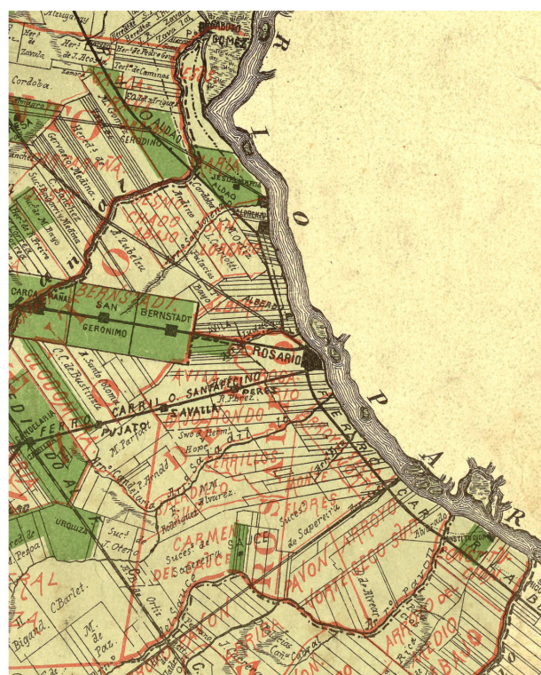
Imagen 1. Localización del área de estudio y sistema ferroviario de la región metropolitana de Rosario en 1889.

A mediados del mismo siglo, el sistema se encuentra frente a una importante crisis, presentando un notable deterioro (Galimberti 2015).