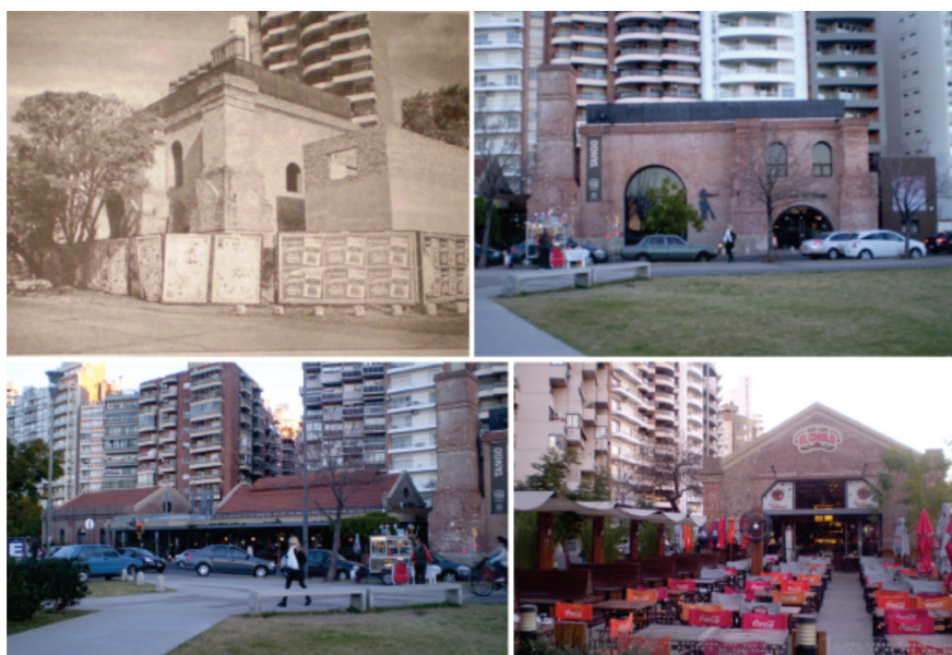
Imagen 4. Actual complejo cultural Casa del Tango.

a fin de poder albergar nuevas funciones. La inauguración de sus refuncionalizaciones se sucede entre fines de la década de 1990 y la primera década del 2000. Es importante destacar que este parque, al igual que el resto de los espacios públicos ribereños, es objeto de una importante apropiación colectiva por parte de la ciudadanía y posibilita una nueva relación entre el tejido urbano y el río Paraná 3 .