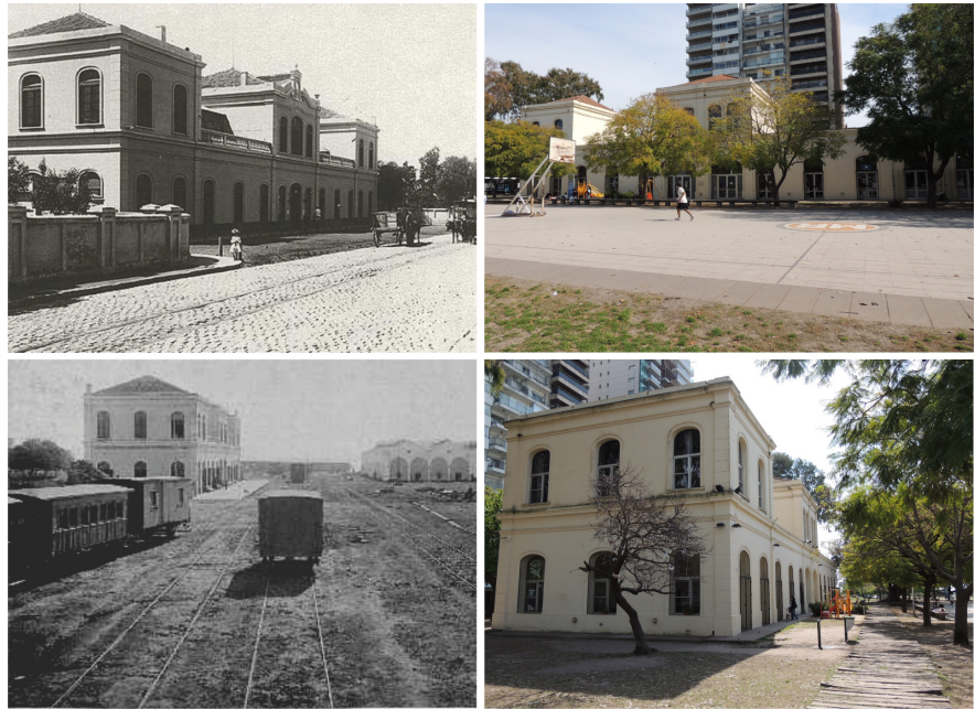
Imagen 2. Estación Oeste Santafesino antes y después.