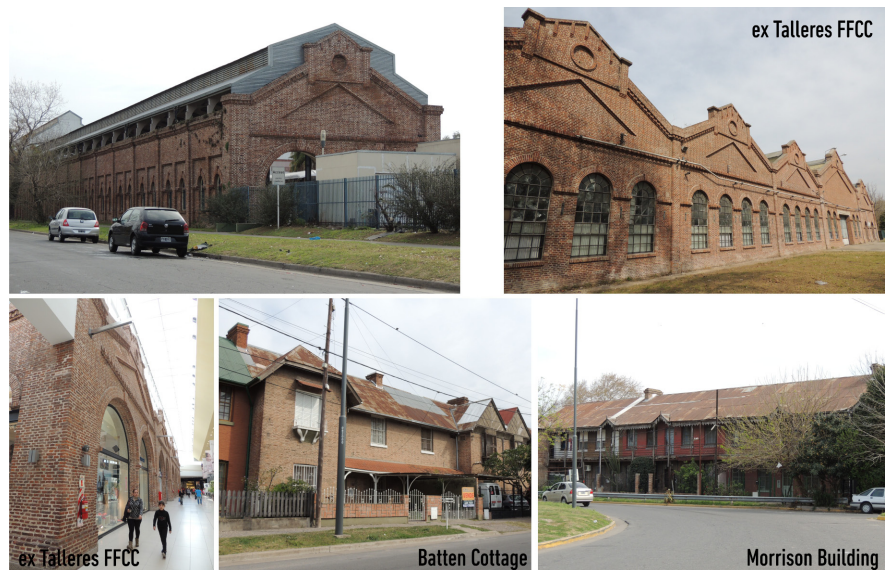
Imagen 6. Reconversión de componentes ferroviarios en torno al nuevo Parque Scalabrini Ortiz (fuente: La autora).

edificios del Batten Cottage, Morrison Building e Iglesia Anglicana, junto al espacio público circundante (imagen 6). Se destaca que, con la reconversión de este predio, se crean más de 20 ha de espacio público (Parque Scalabrini Ortiz y trazados). Esta operación produce la regeneración urbana de un importante sector de la ciudad, seguida del desarrollo de la segunda fase, conocida como Puerto Norte. Estas acciones, si bien posibilitan generar costuras dentro de Rosario y transformar