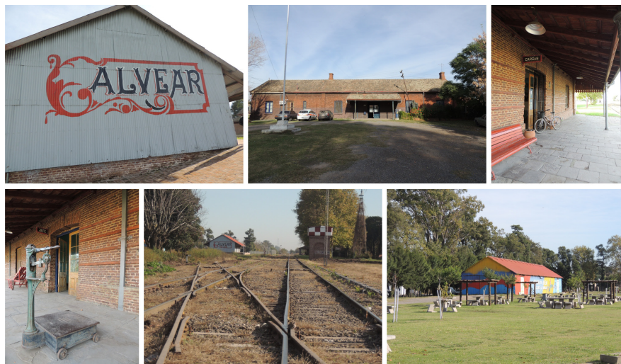
Imagen 7. Refuncionalización del cuadro de estación de Alvear (Fuente: La autora).