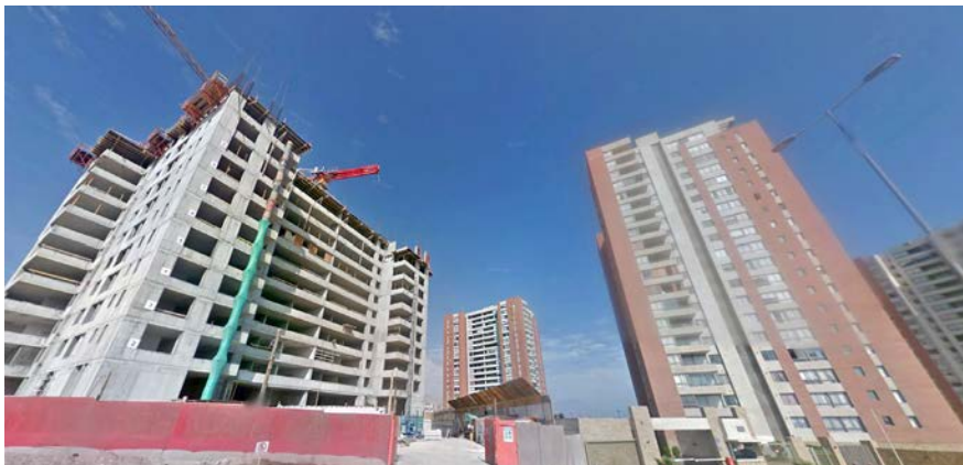
Imagen 4. Antofagasta: del sector primario-minero al desarrollo inmobiliario (fuente: Google Chile, Google Maps Street View de Julio 2012. https://www.google.cl/maps/@-23.694959,-70.419523,3a,90y,188.55h,115.36t/data=!3m4!1e1!3m2!1slvua5L_ZbjyK_E-L6XpV0w!2e0 06.06.2015).