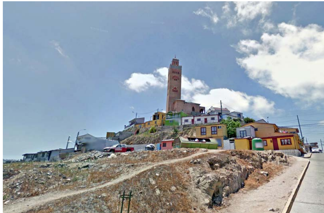
Imagen 7. ¿Dónde se plasma el éxito económico en La Serena-Coquimbo? (fuente: Google Chile, Google Maps Street View de Noviembre de 2012. https://www.google.cl/maps/@-29.963724,-71.335937,3a,75y,41.68h,110.12t/data=!3m4!1e1!3m2!1shZSe6R7o0xIzSxHt0rUIRQI2e0 06.05.2015 ).

ese año Coquimbo es la región con más población con problemas para acceder a prestaciones de salud (25%), superando a La Araucanía (22.6%) y Antofagasta (17.5%). Sin embargo, según la Asociación de Administradoras de Fondos de Pensiones, AFP (2015), la Región de Coquimbo registra el mayor incremento en el ingreso de los cotizantes (20.3% entre 2010-2014, versus 17.4% en el país en igual período). De esa forma, superó al incremento de la R.M. (19.6%) y al de Antofagasta (12.8%), aunque esta última tiene una mejor cobertura previsional (76%) que Coquimbo (55.4%), la que es inferior a la media nacional (68.2%). La Encuesta Casen 2013 indica que Coquimbo estaba entre las cuatro regiones con mayor afiliación al Fondo Nacional de Salud (FONASA), junto a regiones tradicionalmente con más pobreza, todas con sobre 86% de su población en ese Fondo estatal. En cambio Antofagasta, con la menor pobreza según ingresos, presenta la menor tasa en FONASA (65.3%), confirmando que una mayor proporción de su población puede acceder a Instituciones de Salud Previsional privadas (ISAPRES). Estos datos, sumados a los precedentes, confirman la deuda social de la Región de Coquimbo, la económicamente más exitosa de Chile, deuda reflejada en su persistente y alta pobreza por ingresos y también multidimensional, así como en sus consecuencias humanas y urbanas.