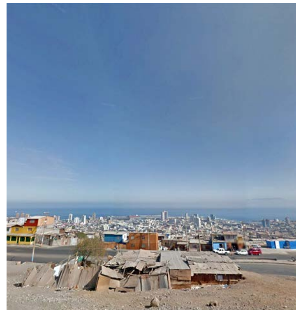
Imagen 8. Contrastes socio-espaciales en Antofagasta. (fuente: Google Chile, Google Maps Street View de Agosto de 2012. https://www.google.cl/maps/@-23.652388,-70.385591,3a,90y,281.64h,103.27t/data=!3m4!1e1!3m2!1sZHkyjAhNJBt2s2!1547YQI2e0 06.06.2015 ).

ese año Coquimbo es la región con más población con problemas para acceder a prestaciones de salud (25%), superando a La Araucanía (22.6%) y Antofagasta (17.5%). Sin embargo, según la Asociación de Administradoras de Fondos de Pensiones, AFP (2015), la Región de Coquimbo registra el mayor incremento en el ingreso de los cotizantes (20.3% entre 2010-2014, versus 17.4% en el país en igual período). De esa forma, superó al incremento de la R.M. (19.6%) y al de Antofagasta (12.8%), aunque esta última tiene una mejor cobertura previsional (76%) que Coquimbo (55.4%), la que es inferior a la media nacional (68.2%). La Encuesta Casen 2013 indica que Coquimbo estaba entre las cuatro regiones con mayor afiliación al Fondo Nacional de Salud (FONASA), junto a regiones tradicionalmente con más pobreza, todas con sobre 86% de su población en ese Fondo estatal. En cambio Antofagasta, con la menor pobreza según ingresos, presenta la menor tasa en FONASA (65.3%), confirmando que una mayor proporción de su población puede acceder a Instituciones de Salud Previsional privadas (ISAPRES). Estos datos, sumados a los precedentes, confirman la deuda social de la Región de Coquimbo, la económicamente más exitosa de Chile, deuda reflejada en su persistente y alta pobreza por ingresos y también multidimensional, así como en sus consecuencias humanas y urbanas.