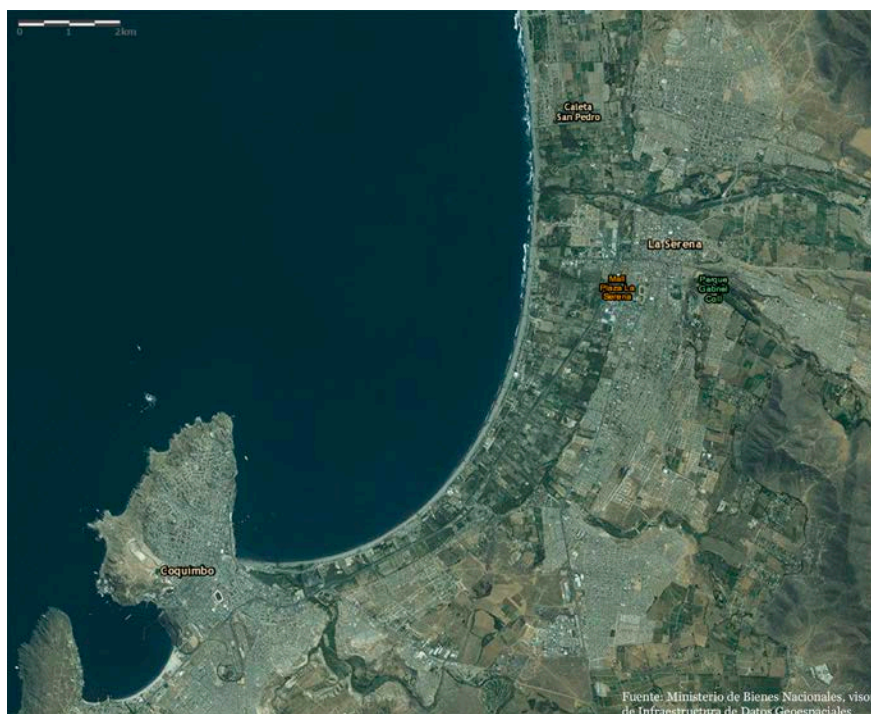
Imagen 1. Conurbación La Serena-Coquimbo (fuente: Ministerio de Bienes Nacionales, visor de Infraestructura de Datos Geoespaciales. http://www.geoportal.cl/Visor/ 06.06.2015).