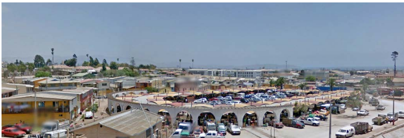
Imagen 6. La tradicional Feria de Abastos de La Serena, una muestra del dinamismo endógeno.