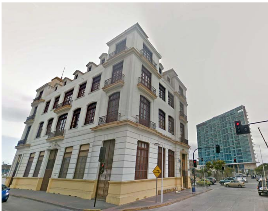
Imagen 5. El desarrollo inmobiliario se diversifica con oficinas y servicios, en contraste con el patrimonio de otras épocas de apogeo minero.