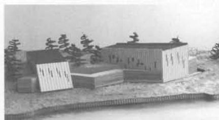
Gimnasio para Sector Gamboa, Castro (Jacqueline Barcia)

La idea de este muro horadado al modo de los palafitos renueva la forma de asentarse en las laderas de Chiloé, estableciendo un diálogo coherente y firme con el paisaje.