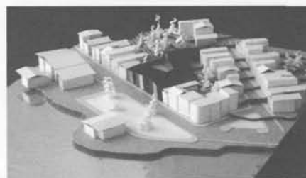
Escuela de Arquitectura (Franco Risco)

El proyecto es una estrategia social, la idea es dotar de infraestructura y a la vez delimitar el sector de los Palafitos de Gamboa en la periferia Castro, ocupando hábilmente terrenos en desuso.