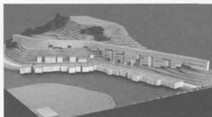
Viviendas Palafito Vertical (Lorena Uribe)

Los proyectos se convierten en mediadores entre la tradición y la modernidad y lo hacen rescatando dos ámbitos: la reinterpretación de topologías y formas provenientes de una tradición arquitectónica nítidamente identificable en la isla y el rescate de las actividades propias del quehacer cultural y religioso, donde explanadas, ferias, costaneras y mercados dan lugar a estas manifestaciones.