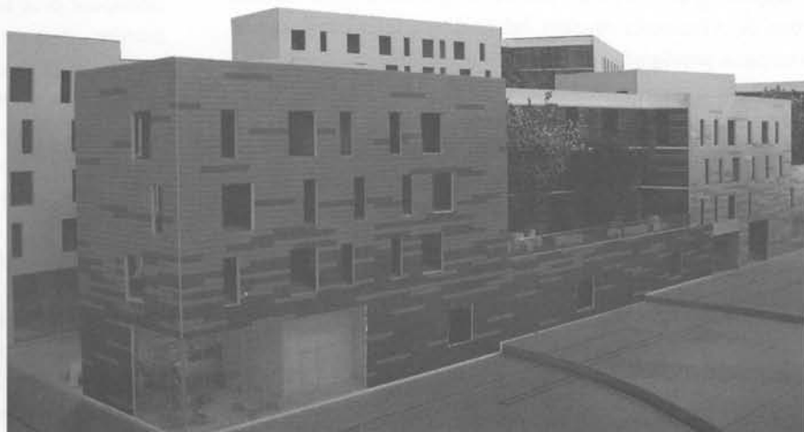
Edificio Mixto, Valdivia. (Andrés Horn)

Integramente, la propuesta es un resultado que grafica claramente la totalidad del saber de un estudiante que finaliza la Carrera de Arquitectura. Abarca todas las áreas que afectan un proyecto de esta envergadura y no solo las resuelve bien, sino que también logra complementarlo armónicamente con el entorno del edificio, destacando la sutileza espacial con la que amarra lo viejo y lo nuevo.