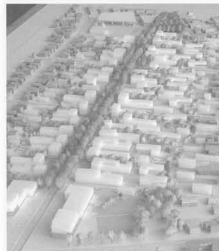
Barrio Sostenible, Las animas, (Fernando Sarce)

Hace décadas se viene experimentando una tendencia a la urbanización del suelo a nivel mundial. En el presente, más de la mitad de la población mundial vive en ciudades, reafirmando la importancia de estudiar los fenómenos que ocurren en ellas como parte de su evolución y desarrollo. A lo largo de este proceso de crecimiento urbano, se han experimentado diversas situaciones, tanto negativas como