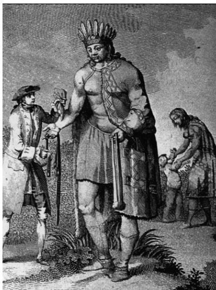
Imagen 1. Patagón gigante de las zonas australes. Grabado del siglo XVIII (fuente: Rojas 1992).