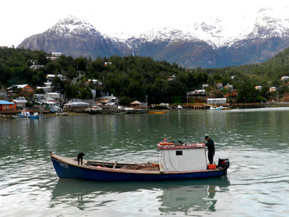
Imagen 6. Poblados que aún retienen la memoria de una antigua colonización (Caleta Tortel).