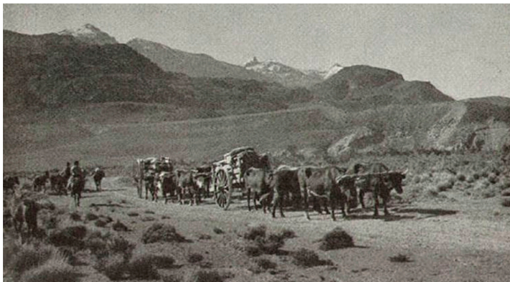
Imagen 3. Colonización espontánea de fines del siglo XIX y principios del XX. (fuente: Biblioteca Nacional).