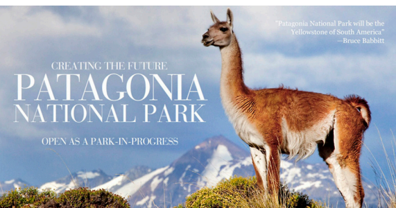
Imagen 5. Nuevos Parques de Conservación, nuevos sentidos geográficos para Patagonia.