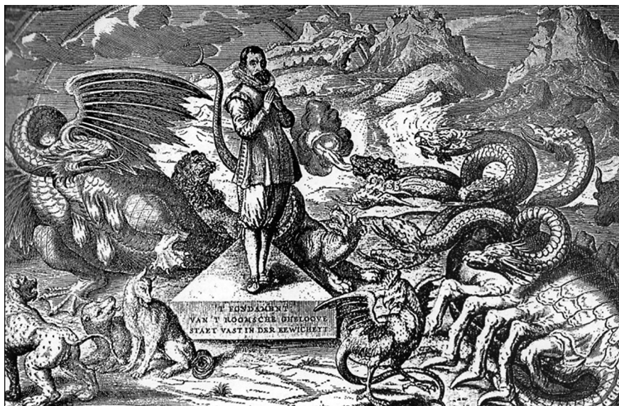
Imagen 2. Paisaje mitológico de la Patagonia del siglo XVI (fuente: Rojas 1992).