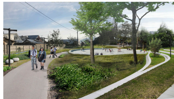
Imagen 4. Imágenes objetivas: Plaza de la Relajación y Plaza del Encuentro, Parque de Integración Villa San Jorge.