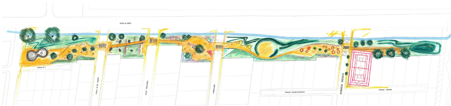
Imagen 3. Bosquejo: Parque de Integración Villa San Jorge en la Comuna de Requinoa.

Actualmente me encuentro diseñando el "Parque de Integración Villa San Jorge en la Comuna de Requinoa" (imágenes 3 y 4), junto al arquitecto Gregorio Barros, donde todas las obras (5 plazas) se están realizando a través de metodologías participativas con 6 comités de vivienda. Allí se aplicó una metodología denominada "La Rueda de la Participación", a través de una etapa de información, una etapa de consulta, una etapa de participación y otra etapa de empoderamiento.