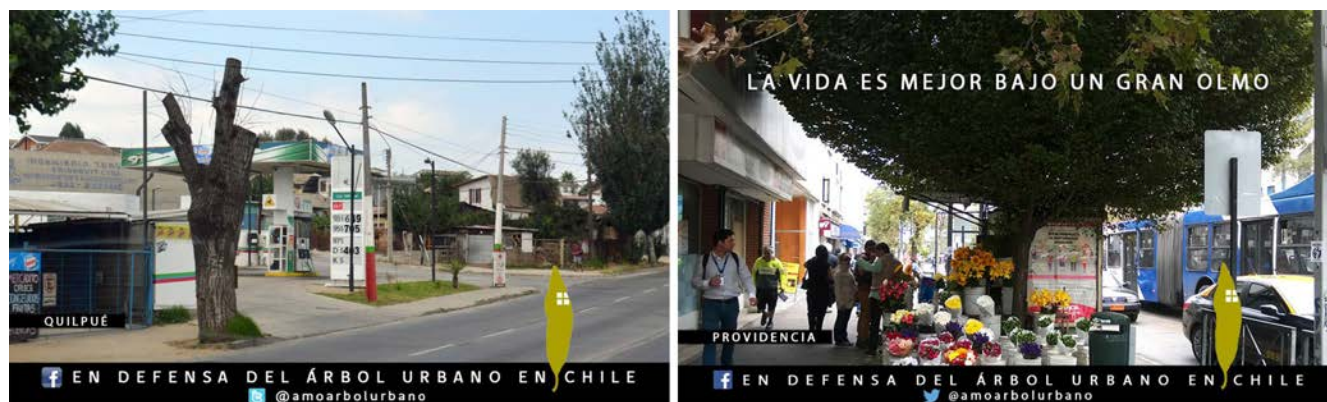
Imagen 2. El grupo de Facebook "En defensa del árbol urbano en Chile" publica imágenes de desastres pero también de buenos ejemplos, como una manera de crear conciencia ciudadana (fuente: https://www.facebook.com/groups/838603902837674/photos/ )