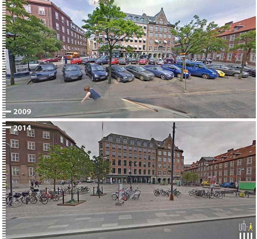
Imagen 3. Aquí una imagen antes y después, que ilustra la apuesta de los daneses por las bicicletas como transporte público

Es urgente cambiar el enfoque de formación de los arquitectos. A diferencia de otros países, en Chile son los arquitectos quienes han heredado la responsabilidad de planificar la ciudad y, en consecuencia, debemos hacernos cargo de esta gran tarea. Es por ello que la formación de los arquitectos no debe llevar a entender la ciudad como una extensión del problema de la arquitectura, sino más bien como la expresión genuina de la forma en la que nos organizamos cultural y socialmente. En consecuencia, no se trata sólo de un problema del diseño. La formación de los arquitectos de ciudad debe ser multidisciplinaria y con una mirada más diversa y sensible en relación a las formas de organización social, cultural y económica. La recomendación para los estudiantes, desde la ciudad, es que moderen su ego creativo al momento de diseñar y que traten siempre de procurar una obra vinculada con y respetuosa del entorno, aunque esto implique exigir la nobleza de pasar inadvertido. ▲●