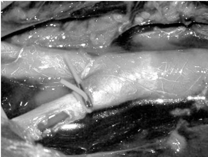
FIGURA 6. Shunt arteria iliaca izquierda.