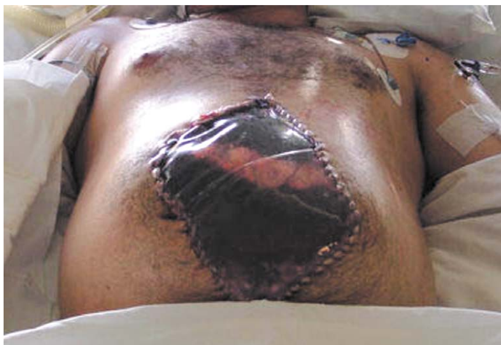
FIGURAS 2, 3 y 4. Bolsa Bogotá.

Existen como alternativa, para casos de sangrado intrahepático, el uso de sonda Foley o Sengstaken – Blakemore. Esta última puede utilizarse en lesiones hepáticas con el balón gástrico insuflado por detrás del hígado y el esófago taponando el sitio de sangrado 10,11,14 .