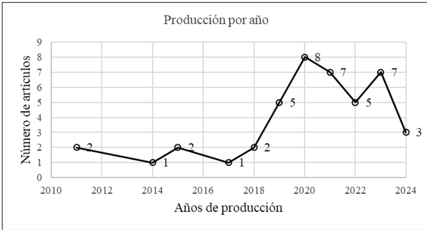
Figura 2. Publicaciones por año 2011-2024.