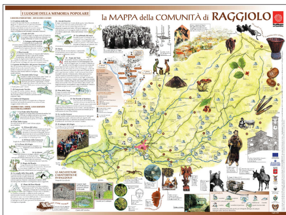
Figura 2. Mapa de comunidad de Raggiolo 6

El proyecto de comunidad de Ortignano Raggiolo (Arezzo) comenzó en 2004 y concluyó en el verano de 2005. Promovido por la Comunidad de Montaña del Casentino de concierto con la Administración Municipal de la localidad y con la contribución de la asociación La Brigata di Raggiolo, el trabajo sobre el mapa de comunidad involucró a grupos de unas 15 personas en el periodo invernal, cuando los residentes ascienden a solo 80 personas, y a grupos más consistentes, de 30-40 personas, en el periodo estival, cuando regresan algunos paisanos y muchos turistas visitan el territorio. En los grupos de trabajo participaron en su mayoría personas ancianas, que constituyen buena parte de la población residente. Por este motivo, el mapa está caracterizado por una orientación al pasado, más que al presente y al futuro.