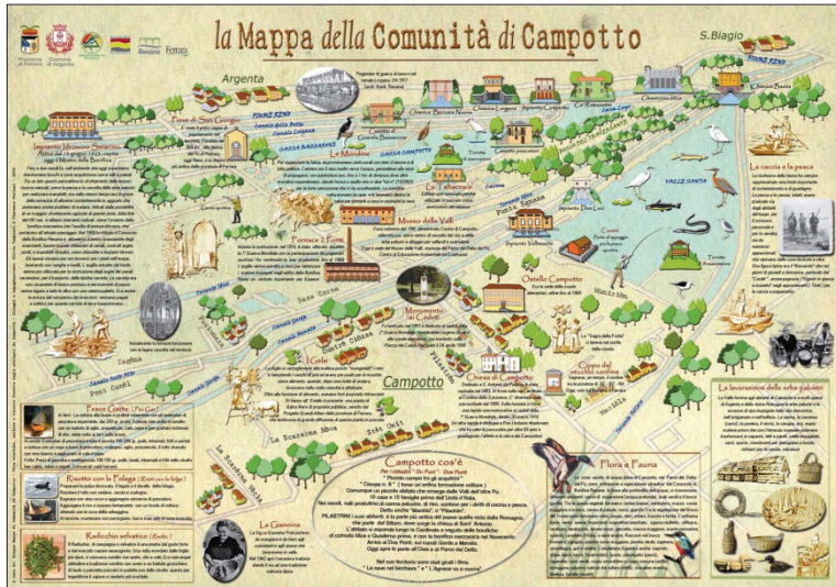
Figura 3. Mapa de comunidad de Campotto 7

El proyecto ecomuseístico sobre el mapa de comunidad de Campotto de Argenta (Ferrara), promovido por la provincia de Ferrara y por el Ayuntamiento de Argenta, comenzó en enero de 2008 y concluyó en enero de 2011. La comunidad, predominantemente anciana, mostró una desconfianza inicial hacia esta nueva forma de participación, que fue superada gracias al conocimiento gradual de los coordinadores del proyecto y a la creación de grupos temáticos de trabajo.