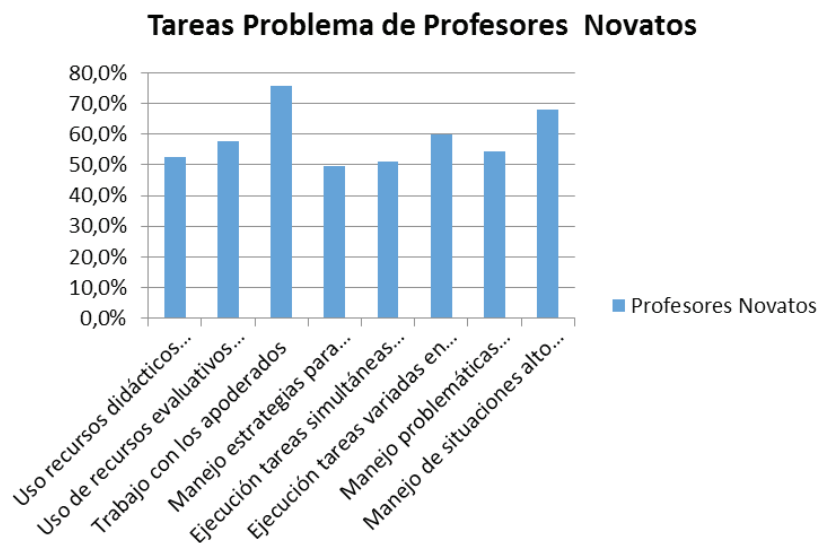
Gráfico 1. Tareas problemas de profesores novatos

En el Gráfico 1 se pueden apreciar aquellas tareas en que más de la mitad de los profesores novatos perciben no estar preparados: uso de recursos didácticos diferenciados (52,5%), uso recursos evaluativos diferenciados (57,6%), trabajo con los apoderados (75,8%), ejecución de tareas de manera simultánea en aula (51,0%), ejecución de tareas variadas en la institución (60,1%), manejo de problemáticas sociales contingentes (54,5%), manejo de situaciones de alto riesgo (68,2%) y bordeando el 50% manejo de estrategias para insertarse como profesor en la institución (49,5%).