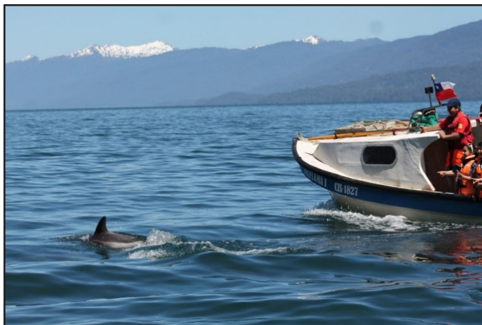
Figura 3: Realizando avistamiento de delfines en el fiordo Puyuhuapi.