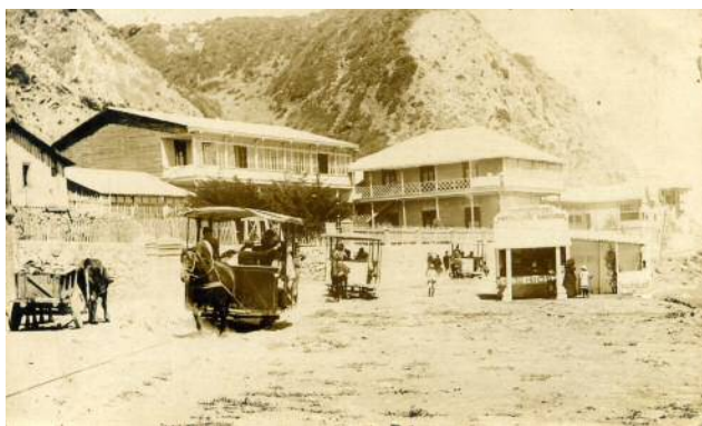
Imagen 3. Carros de Sangre

Carros de Sangre frente a los hoteles costeros ubicados en las playas principales de Constitución. La construcción de infraestructura adecuada para la práctica de actividades estivales daba cuenta de la atención que la sociedad maulina comenzaba a prestar al turismo, percibido como una vía alternativa de desarrollo para un puerto en declive.