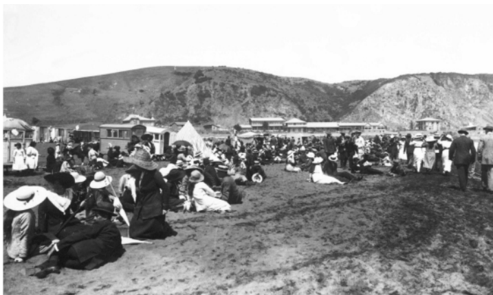
Imagen 2. Playa de Constitución hacia 1900.

Al fondo de la fotografía se aprecian los llamados “Hoteles de la playa”, parte de la infraestructura creada a fines del siglo XIX para potenciar a la ciudad como balneario. Se aprecian también los llamados carros de baño, que pudieron acceder a la playa con mucha mayor facilidad a partir de la apertura de un paso entre el cerro Mutrúm y la ciudad.