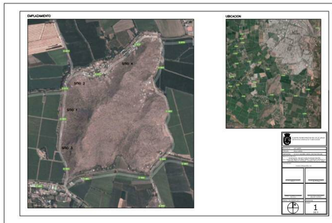
Cerro Patagual. Extraído de Carmona 2013

En la imagen se localizan las cuatro áreas donde se encuentran los bloques rupestres interpretados por Garceau (2007) y Carmona y Basterrica (2013). Todos ellos se entroncan en las márgenes orientales del cerro, por lo que su acceso no significaría un problema para quienes cometen vandalismos sobre estos bienes. Pero esta condición, también acepta la aplicabilidad de recorridos fáciles de establecer para su posterior visita turística.