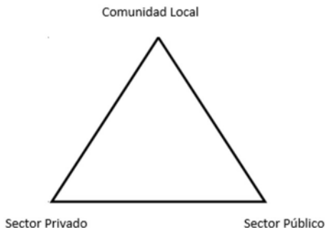
Figura 1. La gobernanza y el TBC

Se escapa de la clásica planificación turística en donde principalmente los esfuerzos recaían en tratar de coordinar al sector público con el privado, sin considerar a la comunidad local como un interlocutor válido a la hora de planificar el desarrollo turístico de un territorio o destino (Pacheco et. al. 2014).