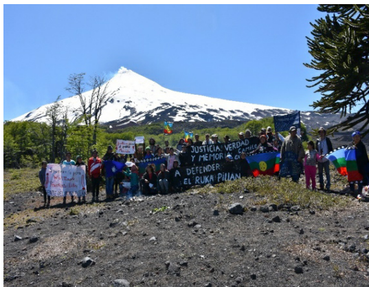
Figura 3. Convocatoria en el Peweñantu en defensa del Rukapillan.

territorio histórico — Peweñantu Rukapillan — y del patrimonio cultural del pueblo mapuche. Señalan que esta intervención estatal, además de fomentar un turismo de elite, dificultará aún más el acceso y uso del territorio ancestral de las comunidades. Argumentan la vulneración de sus derechos consuetudinarios reconocidos internacionalmente, que no solamente implica un problema a nivel paisajístico y ambiental, sino que involucra problemas culturales referidos a su cosmovisión y espiritualidad como pueblos originarios. Alegan no haber sido considerados ni consultados como señala el Convenio 169 de la Organización Internacional del Trabajo (OIT) sobre Pueblos Indígenas y Tribales en Países Independientes, ratificado por Chile en 2008, en desmedro de los derechos que tienen conforme a la Ley Indígena N° 19.253 de 1993, ambos instrumentos vigentes con anterioridad al anuncio de esta concesión, aparte de no haberse efectuado correctamente las evaluaciones ambientales que exige la Ley 19.300 de medioambiente.