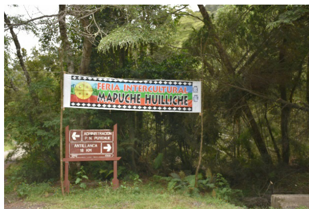
Figura 5. Feria intercultural al interior del Parque Nacional Puyehue realizada por la comunidad Llanquileo en defensa de la cultura y territorio.

cultura huilliche y a sus actividades tradicionales han agregado la turística con la habilitación de un circuito de bajo impacto articulado en torno a la Laguna El Espejo, habilitación de senderos que se internan en el Parque Nacional Puyehue y la realización de ferias interculturales que han servido también como medio de difusión de sus problemáticas.