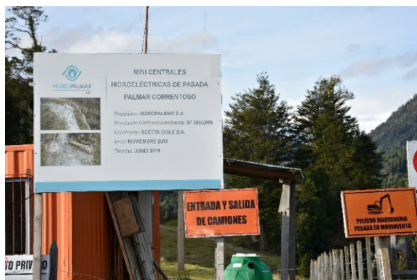
Figura 6. Construcción de minicentrales hidroeléctricas en el deslinde del Parque Nacional Puyehue.

en el borde mismo del límite sur poniente del Parque Nacional Puyehue, en la misma área de amortiguación en que se encuentra la comunidad Calfuco.