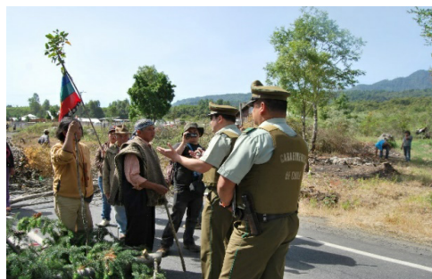
Figura 4. Manifestación en carretera en sector Traitraico.