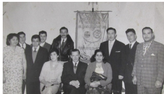
Imagen 3. Directiva sindical, 1963.