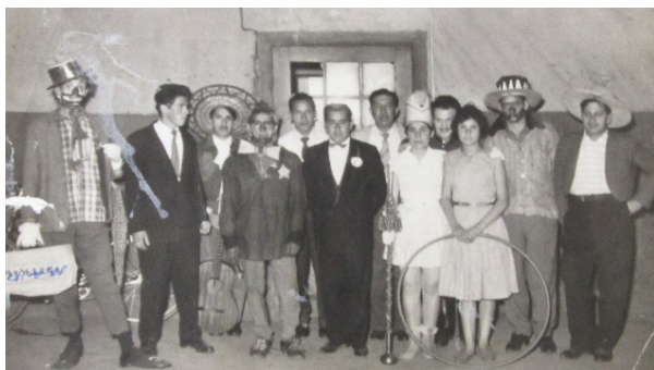
Imagen 4. Actividades para las celebraciones de las fiestas en la fábrica