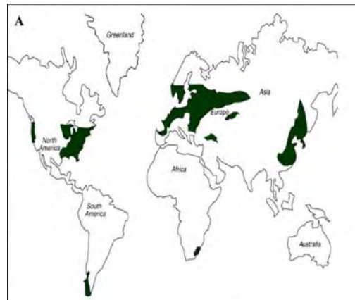
Fig. 1: Repartición de los bosques templados en el mundo