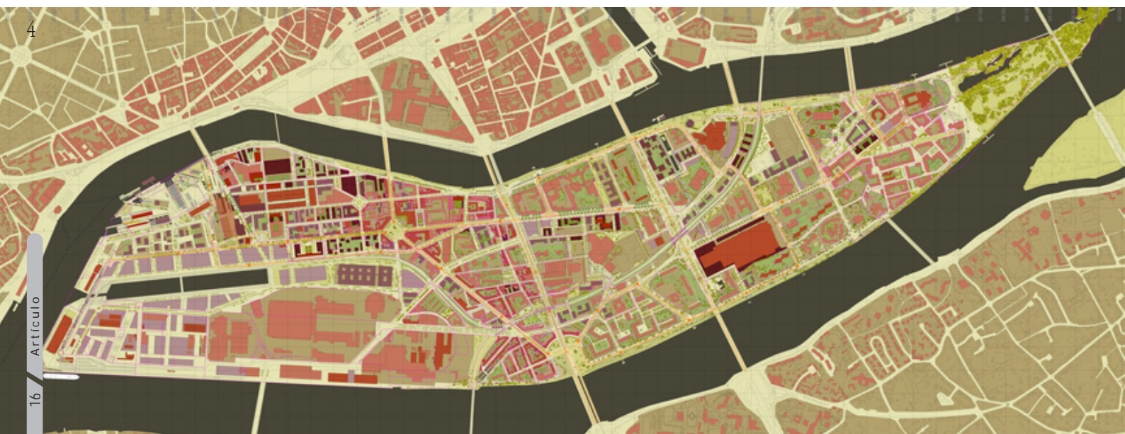
Imagen 4_Plan-guide Île de Nantes.