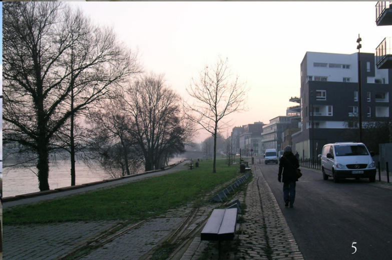
Imagen 5_Île de Nantes (enero 2011).

Sin duda, la transformación del complejo de la naviera Alstom constituye un ejemplo: en 1999, el plan-guide propuso transformarla en un complejo de empresas biotecnológicas pero el proyecto no arraigó y el espacio se convirtió en algo diferente. La Halle 12 fue adquirida por el colegio de abogados para construir su nueva sede en un edificio que ha mantenido la estructura original, la propia naviera decidió permanecer en una de sus antiguas naves rehabilitada, mientras que los demás edificios esperan convertirse en el quartier de la création, gestado a partir del asentamiento temporal de pequeñas empresas locales relacionadas con el mundo de la creación y las telecomunicaciones. Las propuestas de ciudadanos y asociaciones, los empresarios que necesitan un espacio en la ciudad, las cooperativas de viviendas, el tejido industrial que aún conserva la isla, las sedes institucionales, los equipamientos de barrio y aquellos destinados a atraer el turismo, todas las iniciativas pueden ser integradas en el futuro de la isla siempre que sigan el principio básico del plan-guide: tomar como punto de partida lo existente, reconocer el valor del patrimonio de la isla y construir el futuro de la ciudad a partir del legado recibido.