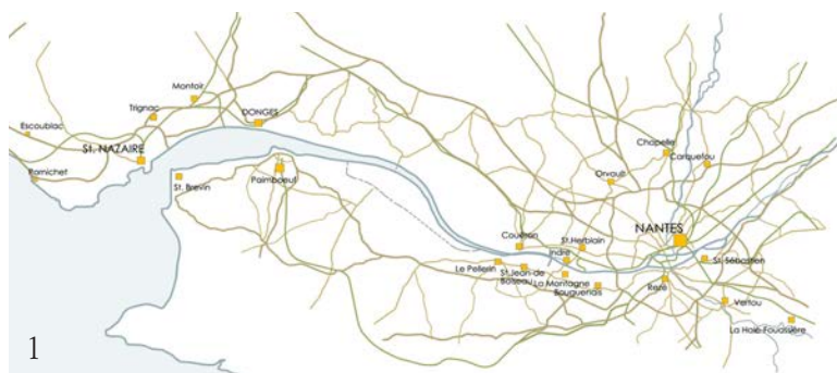
Imagen 1_Nantes en el estuario del Loira.

La evolución de Nantes está marcada por la creación de un espacio económico en torno a la desembocadura del río Loira. Situada en una encrucijada, entre la vía fluvial que organiza el eje este – oeste y la estructura de caminos en sentido norte – sur, Nantes pronto se configuró como ciudad portuaria y espacio de intercambio.