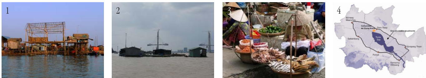
Imagen 1_ Geografía descriptiva. Pulso del Mekong, ciclo hidrológico que define etapas de inundabilidad del asentamiento, en la comunidad de Chong Kneas.