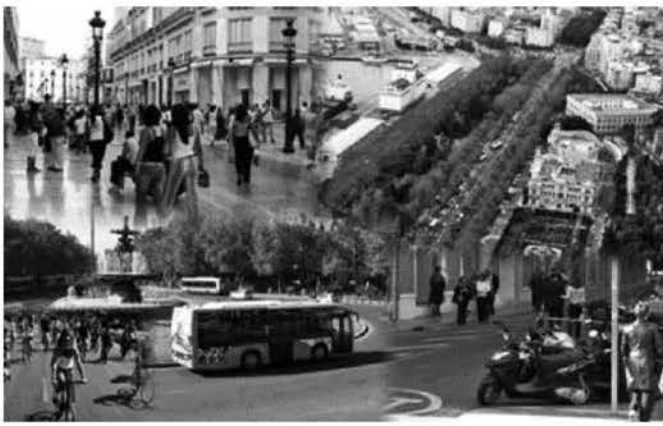
Plan Municipal de movilidad sostenible (PMMS), Málaga. Combinación de distintos modos de transporte, fomento de transporte público y movilidad no rodada.