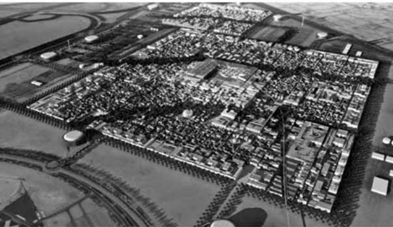
Ciudad ecológica, Masdar, Abu Dhabi, Emirato Arabes, Proyecto de Foster and Partners. Proyectos de ciudad bajo criterios de sostenibilidad urbana en curso.