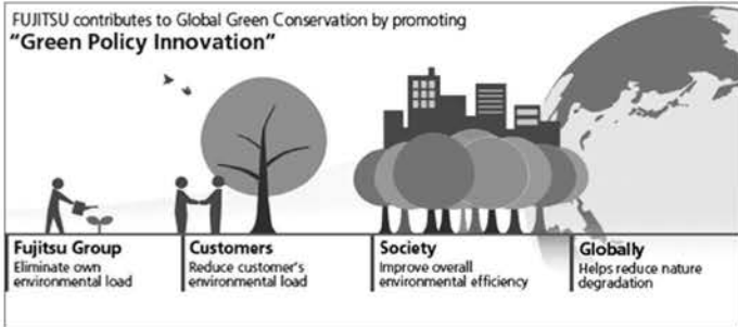
Green Policy Innovation, Fujitsu. Tokyo, Japón. Uso de tecnologías de la información para el control y gestión de un comportamiento ciudadano más responsable con el medio ambiente.