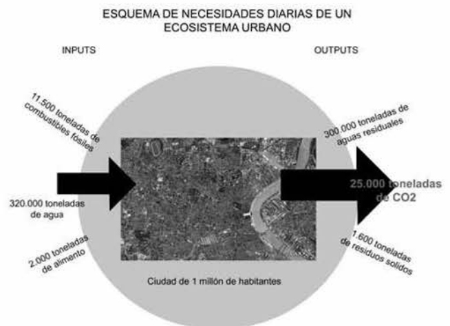
“Esquema ecosistema urbano de una ciudad de 1 millón de habitantes”. (Elaboración propia a partir de datos de España)

Vincular a la comunidad y esta visión general, de desarrollo sostenible de la ciudad o la “Ciudad Emisión-Cero”, crea lazos entre ciudades y comunas dentro de una responsabilidad global, y promueve así una sociedad más solidaria e interrelacionada bajo ideales comunes.