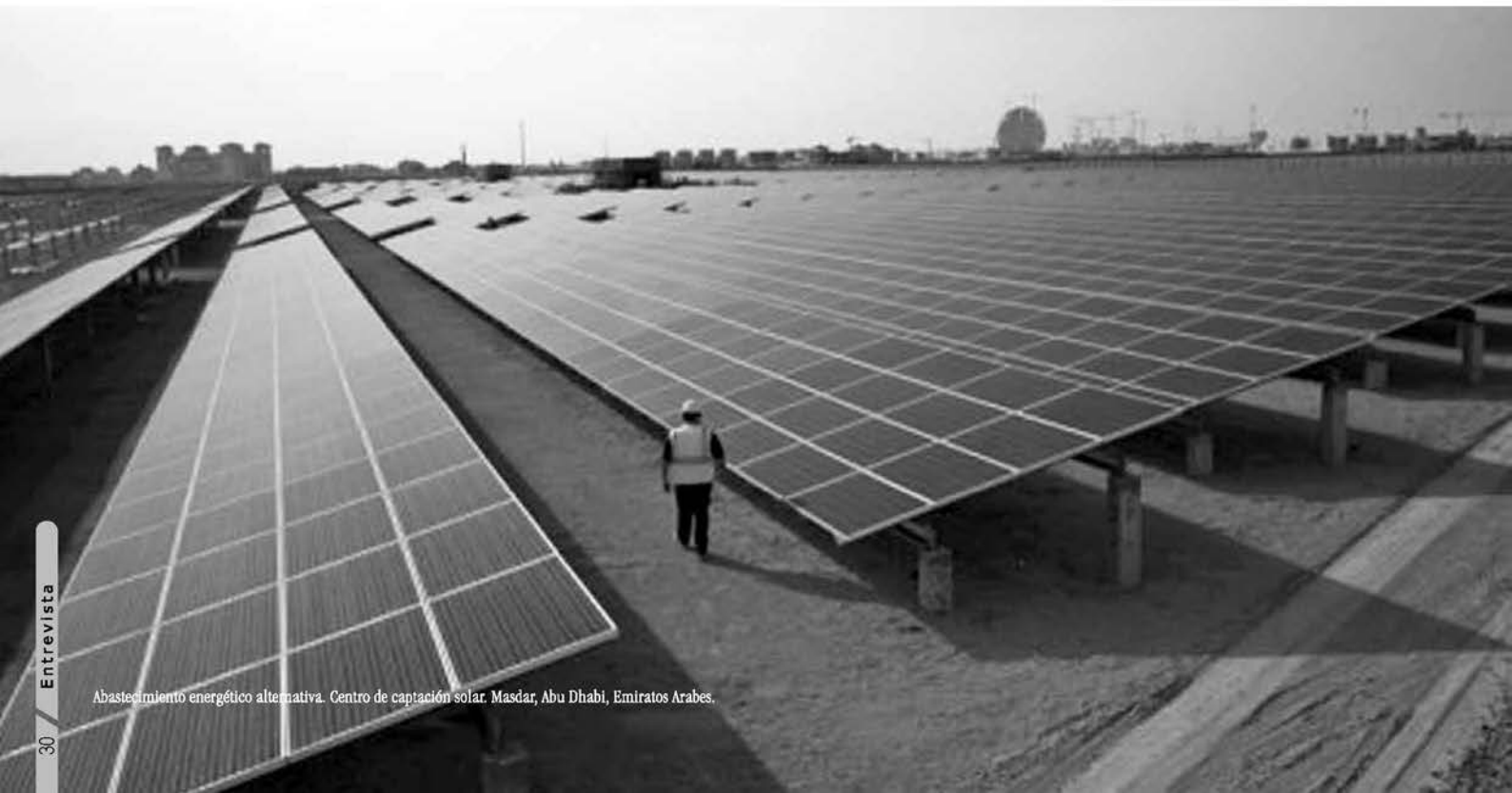
Abastecimiento energético alternativa. Centro de captación solar. Masdar, Abu Dhabi, Emiratos Arabes.

El fin del proyecto es explorar y descubrir nuevas formas de vida urbana donde cada fase de la planificación siguiente sea chequeada y redefinida en función de la reducción de emisión de gases efecto invernadero (dióxido de carbono).