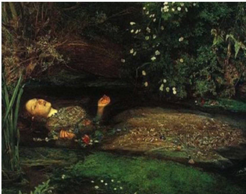
Ofelia de John Everett Millais (1852)

El símbolo del lirio con el de las aguas y el verde esmeralda, presentes en mayor o menor medida en ambas pinturas, inciden en el mismo sentido. Si el lirio se convierte, como indican Chevalier y Gheerbrant, en la flor del amor, “d’un amour intense, mais qui, dans son ambigüité, peut être irréalisé, ou refoulé ou sublimé” 20 (1982: 578); “la peine de l’eau est infinie” 21 como anunciaba Bachelard (2003 [1942]: 13): un agua tranquila y espesa, asociada a una muerte por amor; morada, para la eternidad, de la joven fallecida. Por otra parte, el color verde esmeralda, predominante en ambas pinturas, unido a la piedra preciosa que aparece de forma recurrente en Zoom , recubre una ambivalencia que encuentra su resonancia en las dos obras de Batlle como “la pierre d’Hermès, le messenger des dieux et le Grand Psychopompe” 22 (Chevalier y Gheerbrant 1982: 400). En efecto, la esmeralda reviste una ambigüedad, capaz de vehicular los bienes más preciados o de invocar a las criaturas más maléficas del infierno, una ambivalencia que encontramos igualmente en Combat y Zoom : en el conflicto amoroso como concentración de emociones opuestas, pero también en la guerra como origen de sentimientos contradictorios e insospechados. Por otra parte, el Psicopompo conduce las almas de los difuntos al cielo o infierno, sumergiendo así a Ofelia y a la Dama de Shalott en la noche de la muerte. Una simbología que