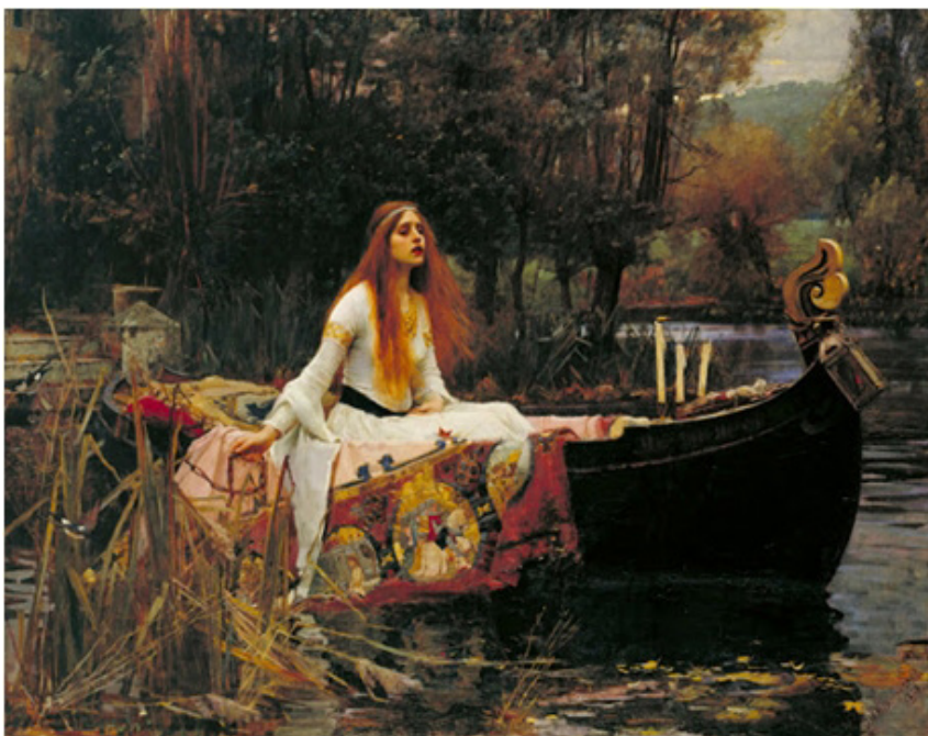
La Dama de Shalott , de Waterhouse (1888).

La pintura de Waterhouse representa una de las escenas de este poema, momento en que la dama, dentro de la barca, canta su última canción dejándose arrastrar por la corriente: “hasta que su sangre se fue helando lentamente / y sus ojos se oscurecieron por completo, / vueltos hacia las torres de Camelot”. La Dama de Shallot nos ofrece así la imagen de una mujer que “arriesga todo, incluso su vida, por el amor” a Lancelot (Demoor 2003: 4); un amor que se revela, desde el inicio, imposible.