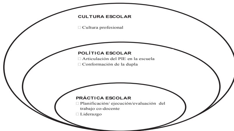
Figura 1. Categorías para el análisis de la práctica co-docente de la dupla participante