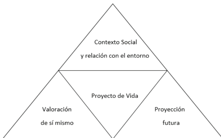
Gráfica 1: Características del Proyecto de Vida

Al hacer una primera observación sobre los resultados que otorgan los estudiantes a los diferentes factores que se pueden tener en cuenta al momento de pensar en la construcción del proyecto de vida, se evidencia una relación a partir de tres dimensiones. Es decir, se evidencia una relación a partir de tres dimensiones: la valoración de sí mismo, la proyección futura y el contexto social y la relación con el entorno. Es posible pensar que en el marco de esa interacción se produce la construcción de un proyecto de vida que en el marco de un contexto vulnerable como el que se analiza, se comprende a partir de la tensión entre las metas vitales y el entorno social en el que se construye ese itinerario vital. En este sentido, la proyección vital es algo complejo, contradictorio, sujeto a las dinámicas económicas del entorno y a las problemáticas de las estructuras sociales heredadas de un conflicto que se ha desarrollado durante 40 años en el Urabá Antioqueño. Esta perspectiva se puede identificar a través de la siguiente representación gráfica: