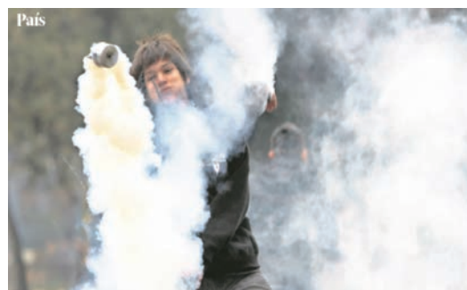
Imagen 1. LT_3

Las acciones violentas de los manifestantes – lanzando una bomba lacrimógena (imagen 1) o atacando un carro policial (imagen 2)– son presentadas en imágenes donde aparecen rodeados de gas lacrimógeno, lo que intensifica la prominencia de estos actores en la imagen. Asimismo, tienden a estar representados cerca de los márgenes de la imagen, quizás consolidando el