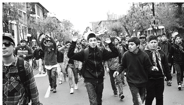
Imagen 3. ES_3

Como se mencionó anteriormente, la narrativa del conflicto y antagonismo está ausente en este periódico semanal. Carabineros es representado como lejano al observador, siendo obstruido por otros actores o presentados de espaldas e imposibilitándose su identificación, excepto por el uso de sus uniformes. Su presencia es mínima, siendo construidos al margen de la imagen, donde el centro es ocupado por manifestantes congregados en actitud pacífica. Se destaca, además, la inclusión de las motivaciones e intenciones de los manifestantes en imagen 3, donde aparece un lienzo explicando que la marcha es por la educación y se muestra a jóvenes estudiantes, muchos vistiendo uniforme escolar. Esto, junto a la inclusión de ACES y CoNES, refuerza la presencia de estudiantes secundarios en la marcha, no solo reconociendo a diversos actores en el movimiento social, sino también facilitando la asociación de que la violencia desmedida registrada ese día fue ejercida contra menores de edad. Esto también se aprecia en imagen 4, donde los jóvenes manifestantes son rodeados por Carabineros y se aprecia que reclaman incrédulos (lenguaje