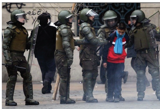
Imagen 6. TC_20