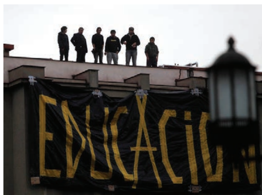
Imagen 7. TC_13

Finalmente, cabe destacar la inclusión de las motivaciones detrás de la convocatoria a las protestas, a través de la representación de lienzos con las demandas del movimiento estudiantil. Mientras que TC_1 17 se puede interpretar como las demandas estudiantiles y los representantes del poder institucionalizado literalmente divididos y asimétricos en su relación (lienzo y Carabineros se encuentran separados por una torre en el fondo, dividiendo la imagen en dos), imagen 7 posiciona las