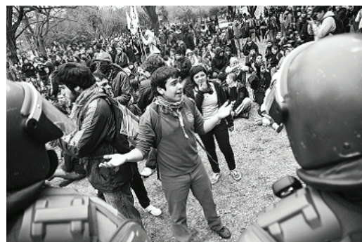
Imagen 4. ES_5