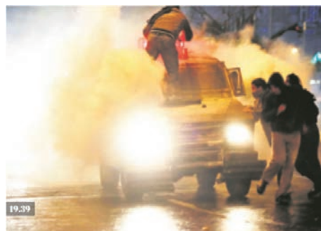
Imagen 2. LT_4